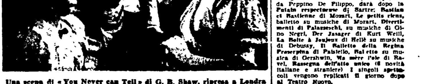
Una scena di «You Never Can Tell» di G. B. Shaw, ripresa a Londra

publicherà scritti di MARX ed ENGELS sul RISORGIMENTO ITALIANO