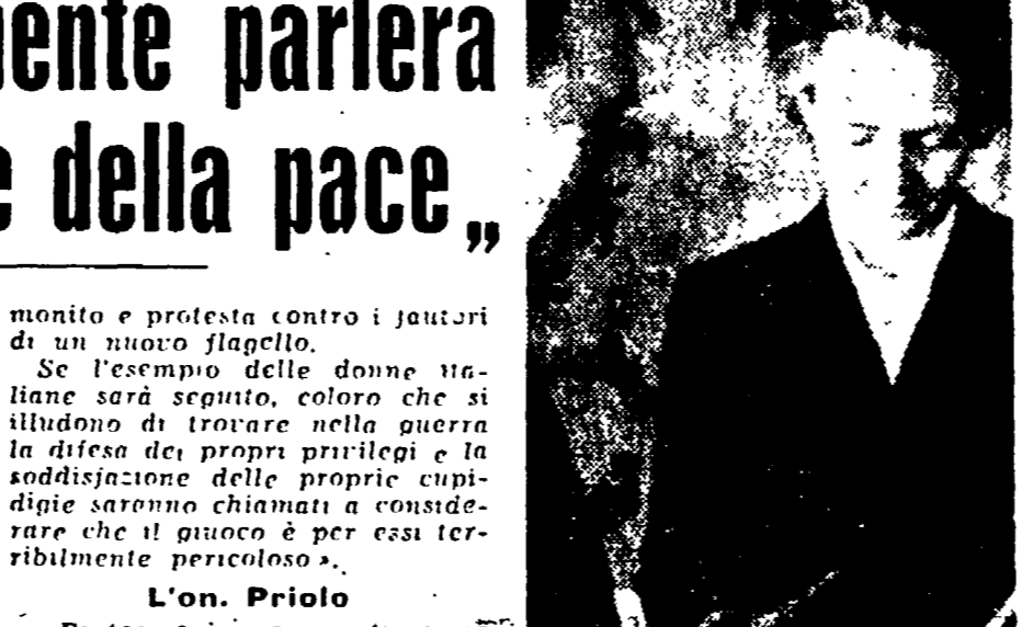
La famosa scienziata francese Eva Joliot-Curie (premio Nobel) figlia di Maria Curie, accoglierà tutti con profondo senso di responsabilità.

Centinaia di comizi, di feste, di manifestazioni e di solenni cerimonie hanno preparato questo grande convegno democratico.