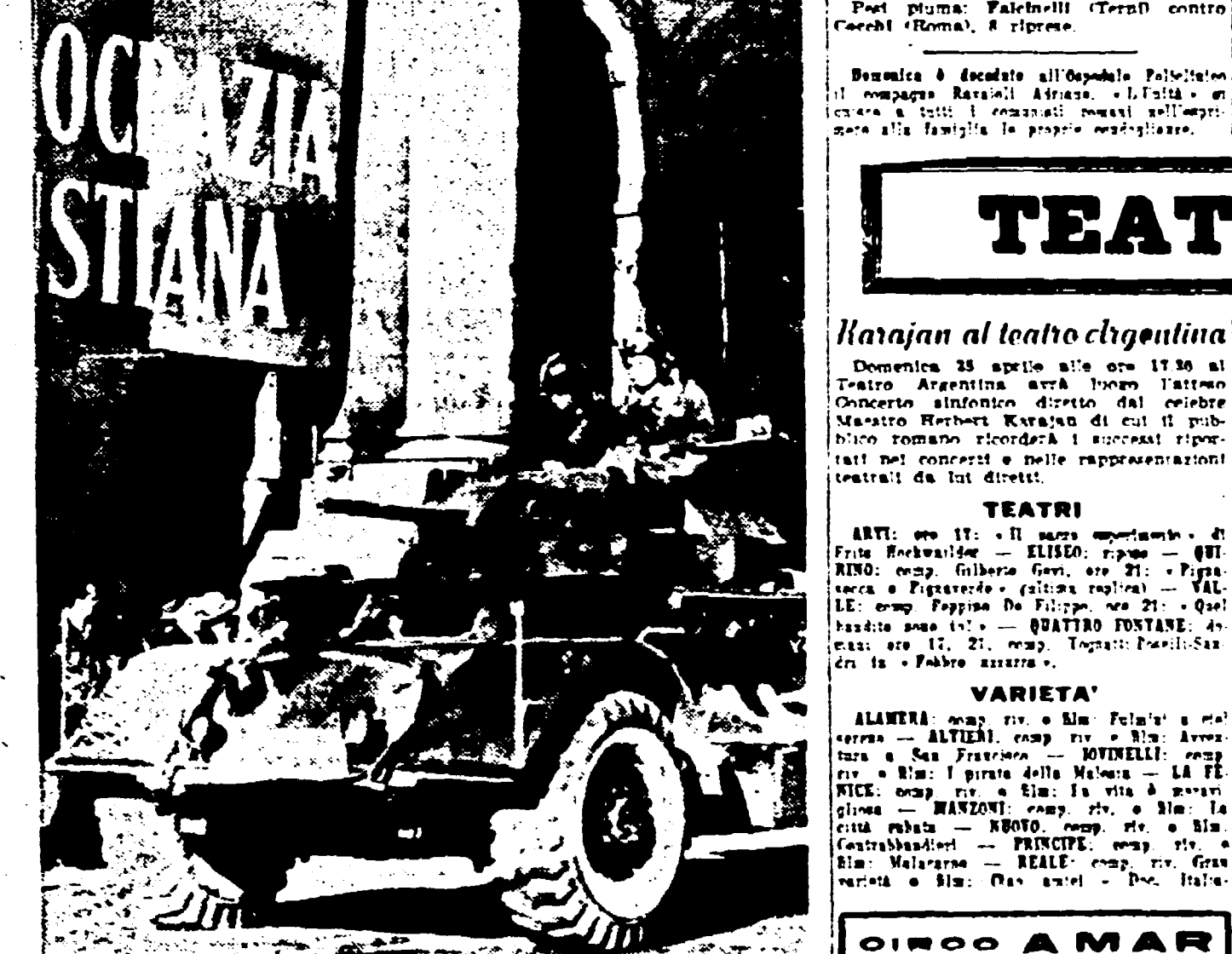
Ieri sera l'on. Alcide De Gasperi si è recato alla sede del Comitato romano della D.C. a Via del Corso. Tre corroni di carabinieri e agenti con mitra impediscono il passaggio nella zona Piazza Colonna - Giordano Bruno. Poi c'erano parecchi nuovi tipi di auto da diporto. Sì, che c'è non di sente sicuro neanche con la maggioranza assoluta!