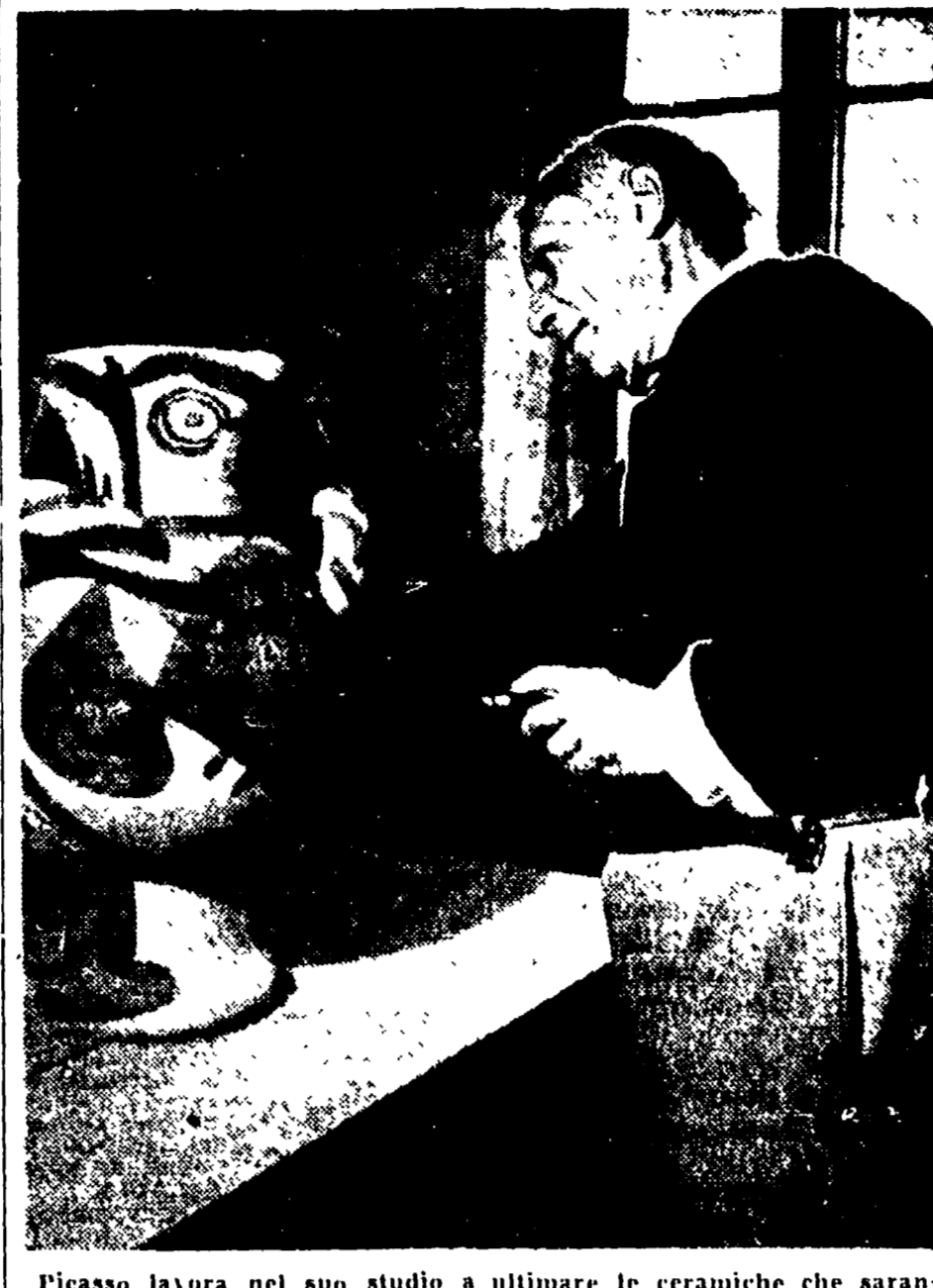
Picasso lavora nel suo studio a ultimare le ceramiche che saranno inviate alla Biennale Internazionale di Venezia