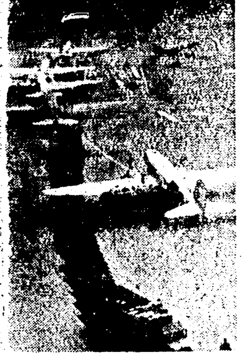
Aerei a Berlino. Costano 80 milioni di dollari al giorno...