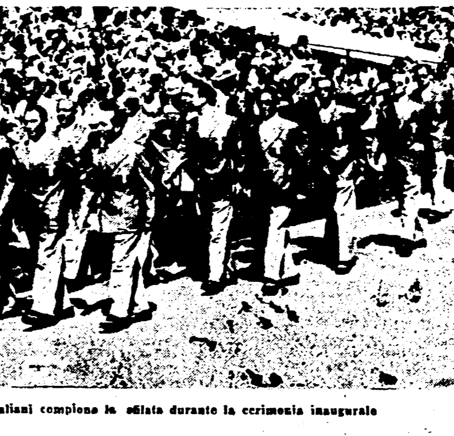
Con la bandiera tricolore in testa, tutti gli atleti italiani compiono la sfilata durante la cerimonia inaugurale

La R.A.I. ha organizzato un ciclo di conferenze dedicate alle 1511 Esposizioni Biennale Internazionale di Arte di Venezia, destinato ad illustrare nel tempo le opere di arte.