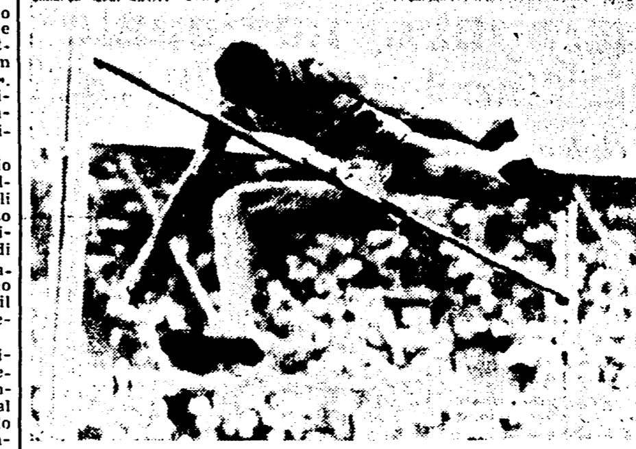
L'austriaco Winter, che ha conquistato il titolo olimpionico di salto in alto, superando metri 1,98