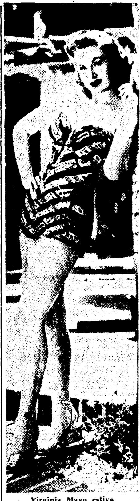
Virginia Mayo esulta

Li per la prima volta divenne chiaramente visibile per tutti che la campagna di intimidazione sistematica che era stata lanciata contro il New Party non avrebbe avuto effetto.