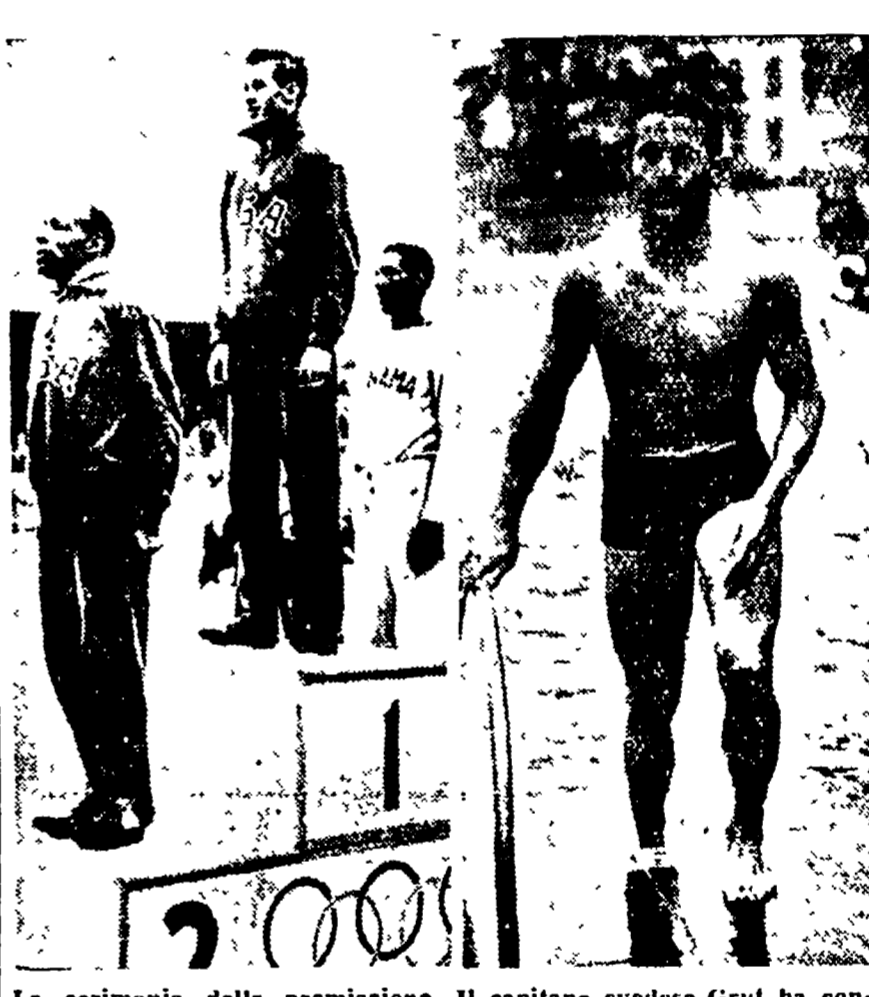
Scherma femmine - L'italiana Camber ha battuto l'ungherese Kubo. Il capitano svedese Grut ha concesso il titolo del pentathlon sui 200 metri piani. In primo nella specialità che comprende cinesimo Ewell, secondo arrivato: que gare: equitazione, nuoto, dietro di lui Patton, il vincitore: scherma, tiro a segno e corsa.