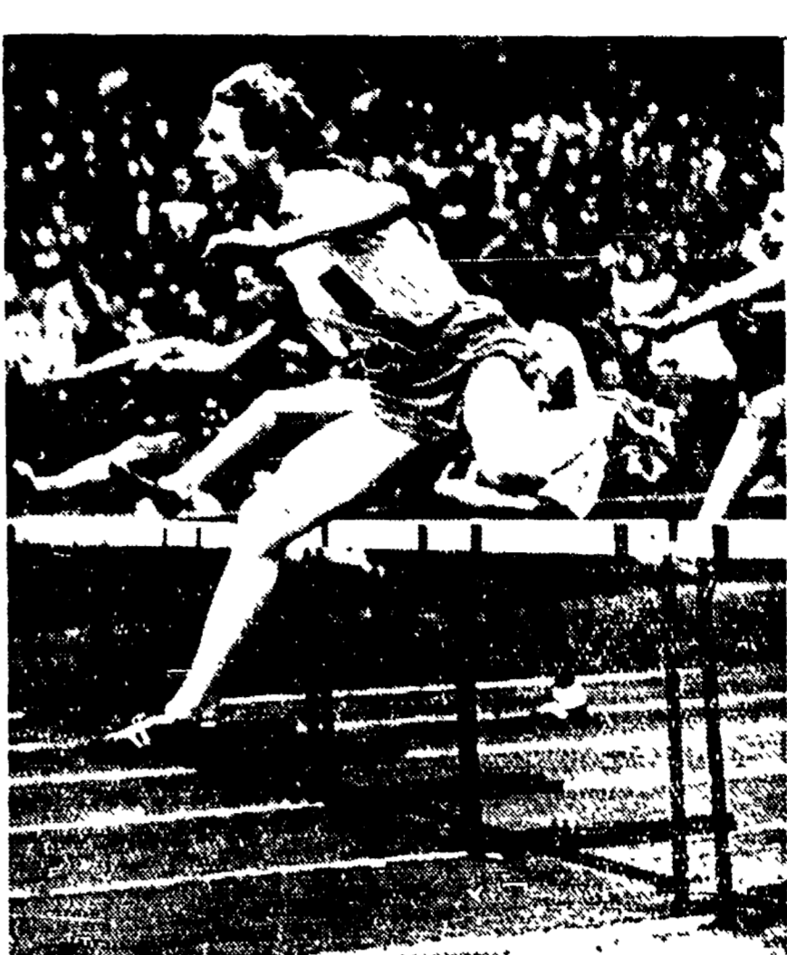
Fanny Blankers-Koen ha ieri conquistato il suo secondo titolo olimpionico, quello degli 80 metri ad ostacoli. La bionda olandese, dall'aspetto apparentemente esile, è senza dubbio la più formidabile campionessa dei nostri tempi.