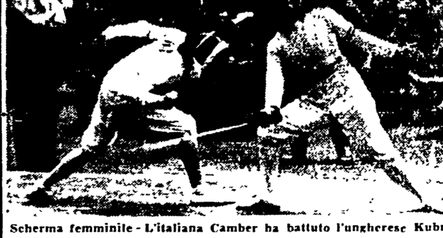
Scherma femmine - L'italiana Camber ha battuto l'ungherese Kubo.