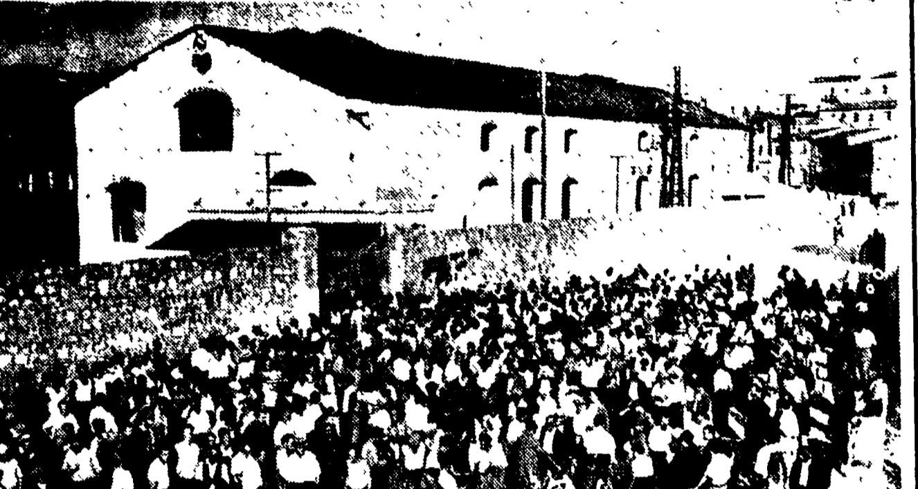
La storia industriale dell'Elba incontra alla fine del secolo scorso, quando nell'isola furono installati i primi e più importanti altiforni d'Italia. A Portoferraio da tutte le regioni affluirono allora numerosi operai specializzati. Nel vulgere di mezzo secolo essi conquistarono col loro lavoro uno dei primi posti alla produzione siderurgica nazionale.