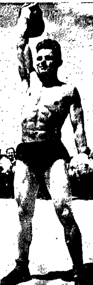
Il campione sovietico di sollevamento pesi Protopopov, durante un suo esercizio.

che del resto era in corso da anni: fu invece la fine, Come mai? In tutti i Partiti, sopra tutti i partiti, ci furono allora in Italia degli uomini che parlavano liberali nell'occasione. In Italia era viva ancora la coscienza liberale; l'Italia era ancora un paese civile. Figuratevi cosa sarebbe successo ora da noi il 14 luglio se l'antifascista fosse stato un comunista e la vittima fosse stata un segretario politico D. C. La coscienza liberale: seccata da quella spogione ogni terra è un deserto, spunto quel sole ad ogni ora è notte. Regnò davvero sull'Italia nostra quell'arsura e quel buio? L'aridità davvero l'Italia, pur dopo il 25 aprile del '45, quello che essa fu per tanti anni e quello che essa fu nel '22, un paese di barbarie. No, se come io credo — una coscienza liberale vive ancora in qualche parte di essa. Dove? In chi riposta? Vedremo.