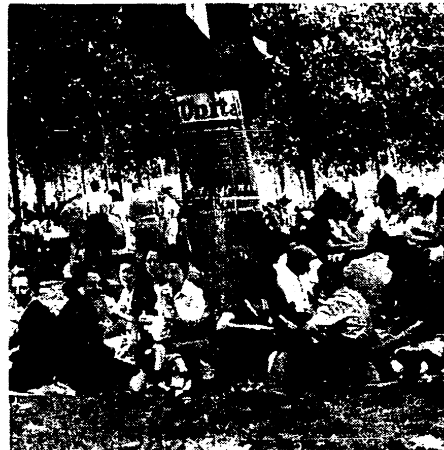
MILANO, 1947 - La grande festa campidana organizzata in occasione del «Mese della Stampa Comunista» vede centinaia di migliaia di lavoratori milanesi accomunati in un memorabile raduno.