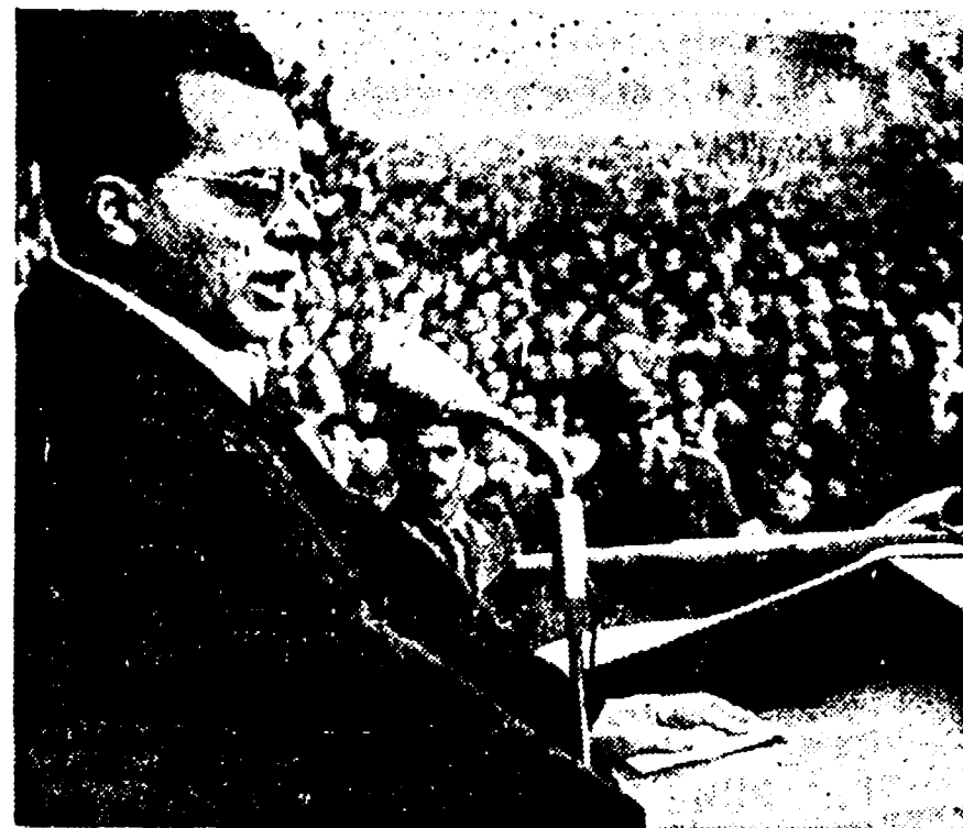
ROMA, 1946 - Si inaugura alle Terme di Caracalla il «Mese della Stampa Comunista». Il compagno Togliatti indica la strada da seguire per vincere la grande battaglia in difesa della libertà di stampa.