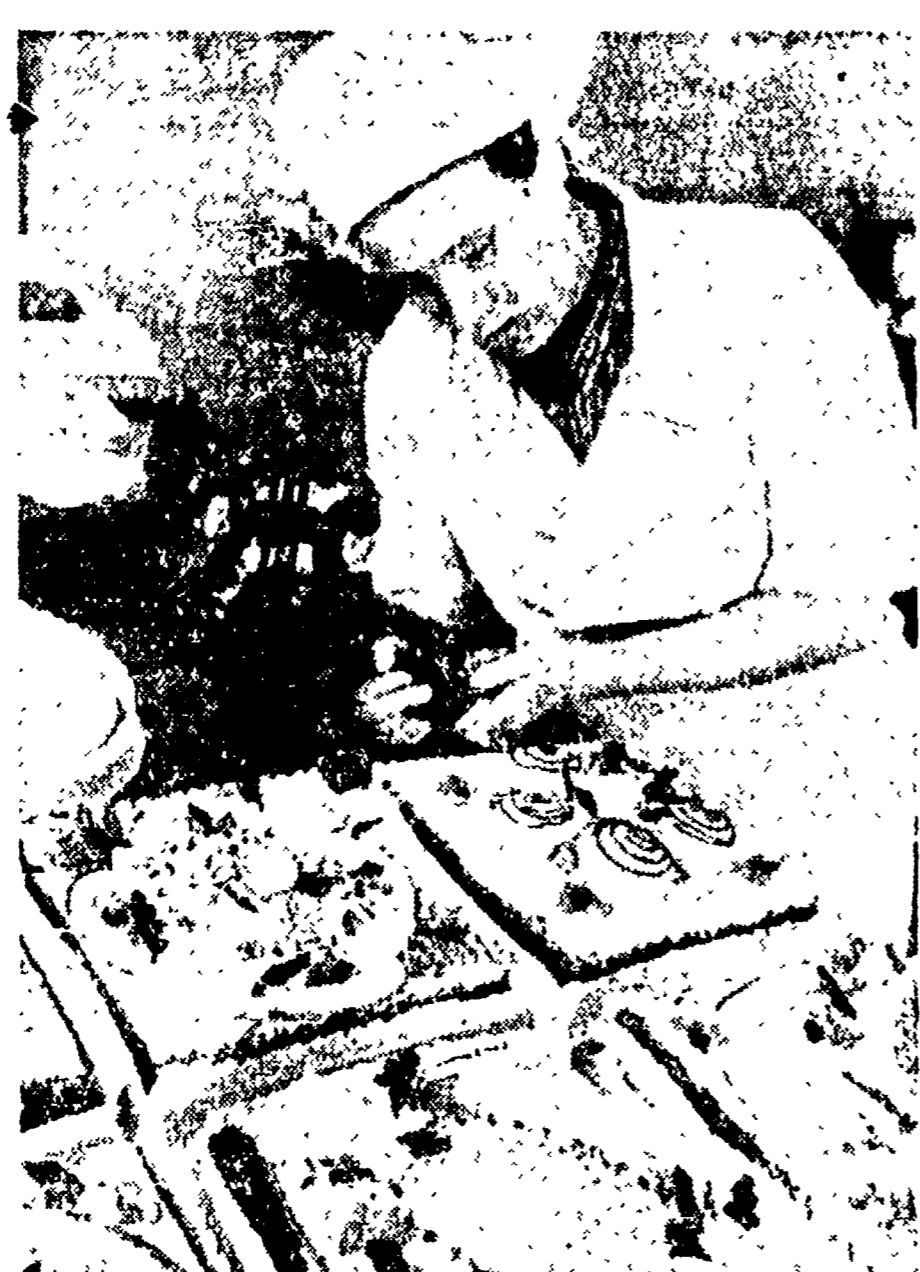
MOSCA - Le industrie di confezioni nell'U.R.S.S. lavorano a pieno ritmo. Nel 1948 la vendita della pasticceria è aumentata del 41 per cento...