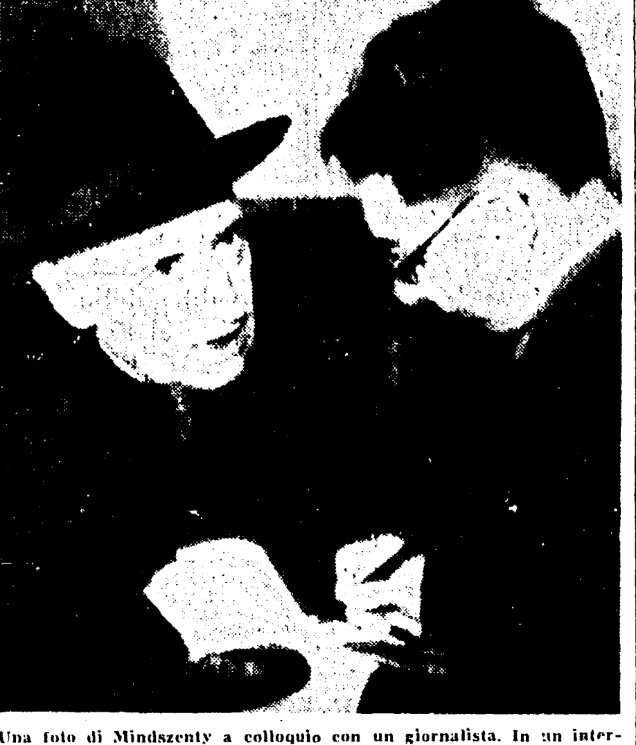
Una foto di Mindszenty a colloquio con un giornalista. In un intervallo del processo il Presidente ha permesso loro che il Cardinale e gli altri imputati si intrattenevano con visitatori e parenti

Oggi deputati e senatori diffonderanno "l'Unità,,