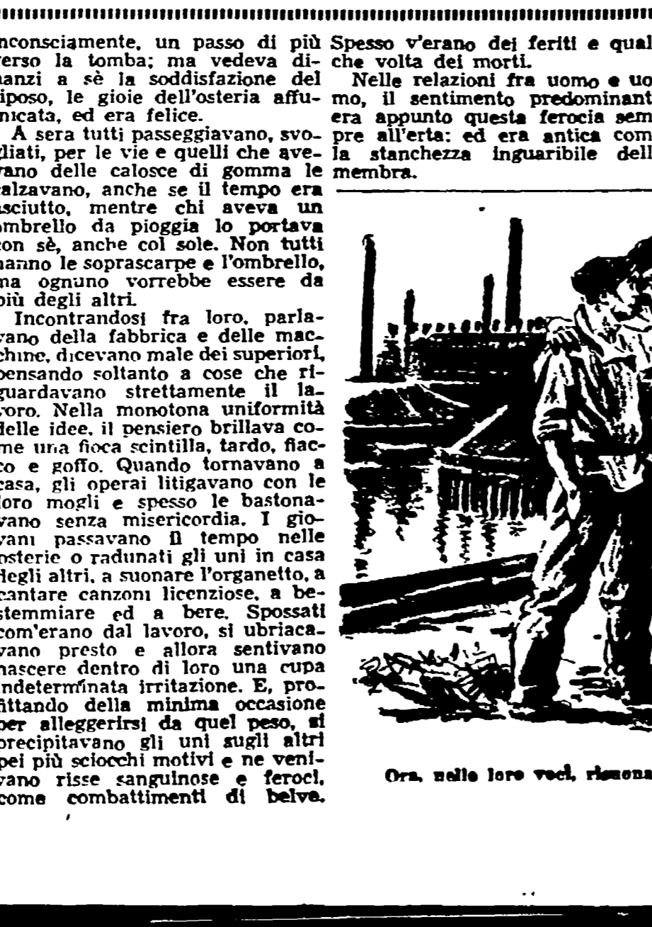
Ora, nelle loro voci, risuonava la vivacità e quella di gioventù. (Qui, di De Amicis)