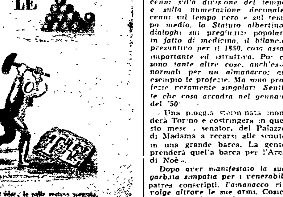
Quando si tira il cannone contro le idee...