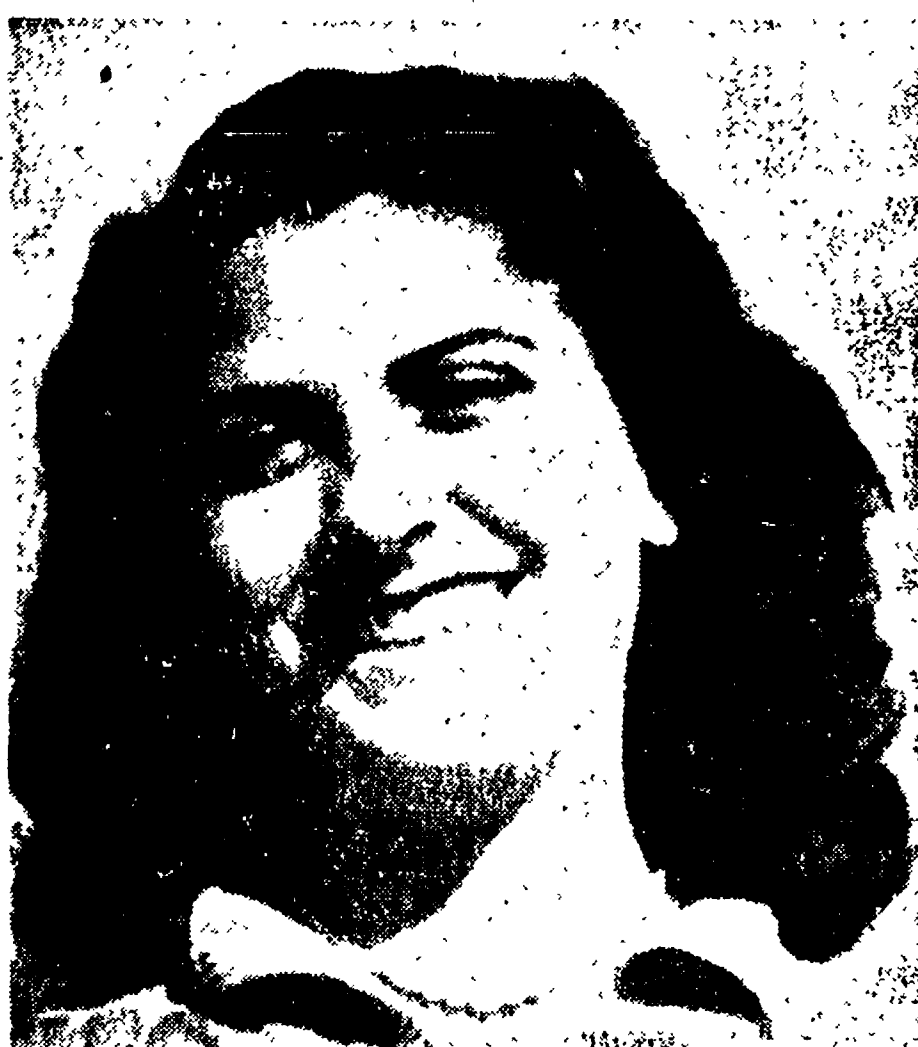
Milioni di donne si apprestano a celebrare la loro festa...

LA MADRE Grande romanzo di MASSIMO GORKI