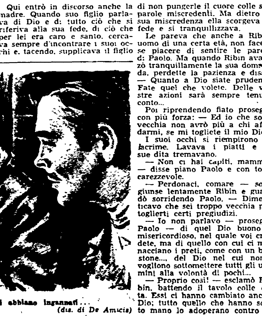
Tu credi dunque che ci abbiano ingannati...

Vertical text on the right side of the page, including a large advertisement for 'LA MADRE' and other notices.