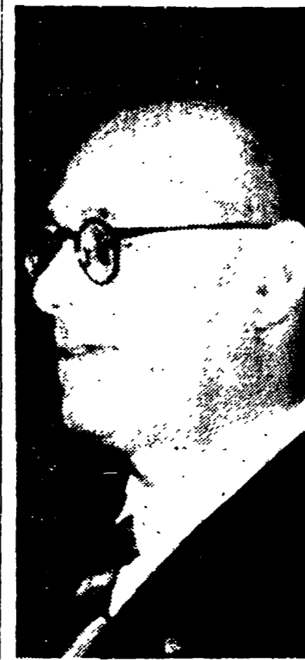
Il compagno Umberto Terracini nell'anima dei nostri partigiani.

«Nessuno crede che la Russia voglia prepararsi un esercito di guerra in ogni modo il Patto Atlantico è indispensabile».