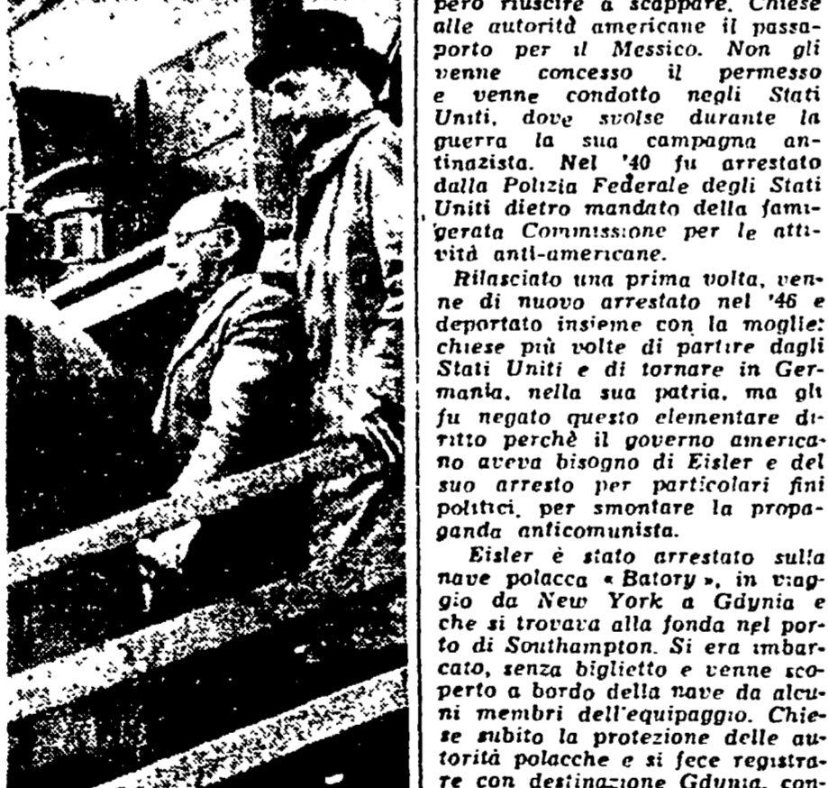
GERHART EISLER, il grande antifascista tedesco scende sul «dock» di Southampton circondato dai poliziotti britannici...