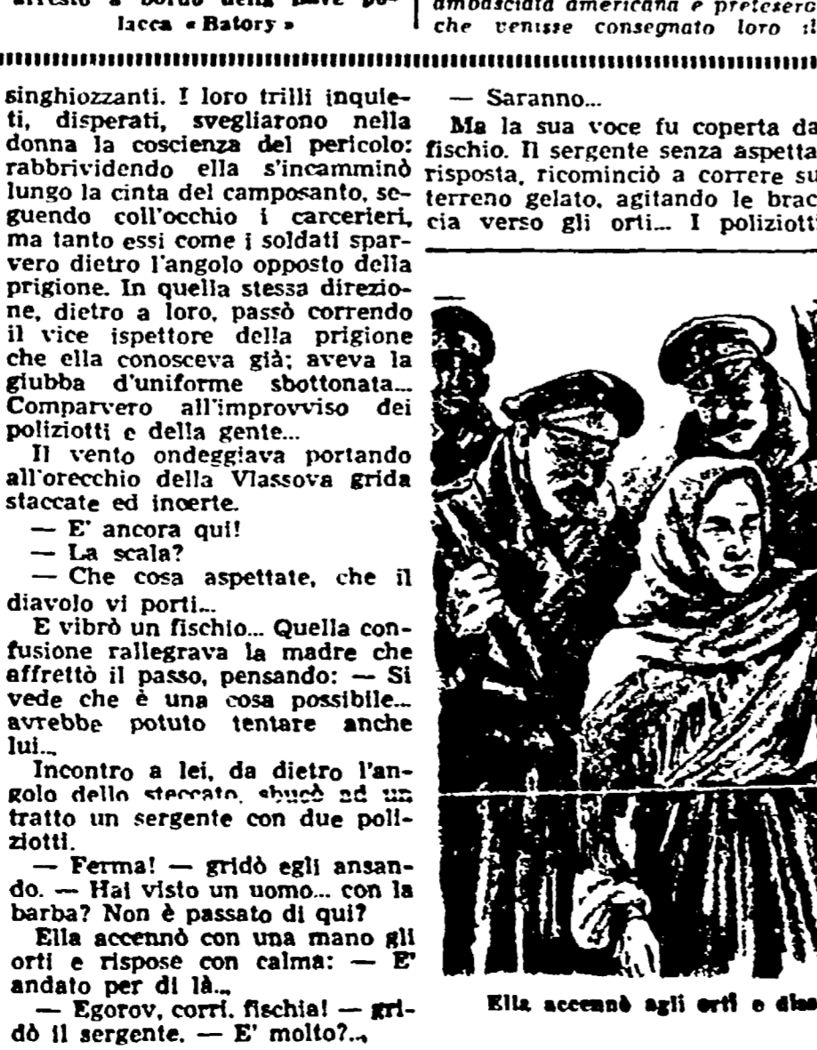
Ella accennò agli orli e disse: «E' andato per di là».