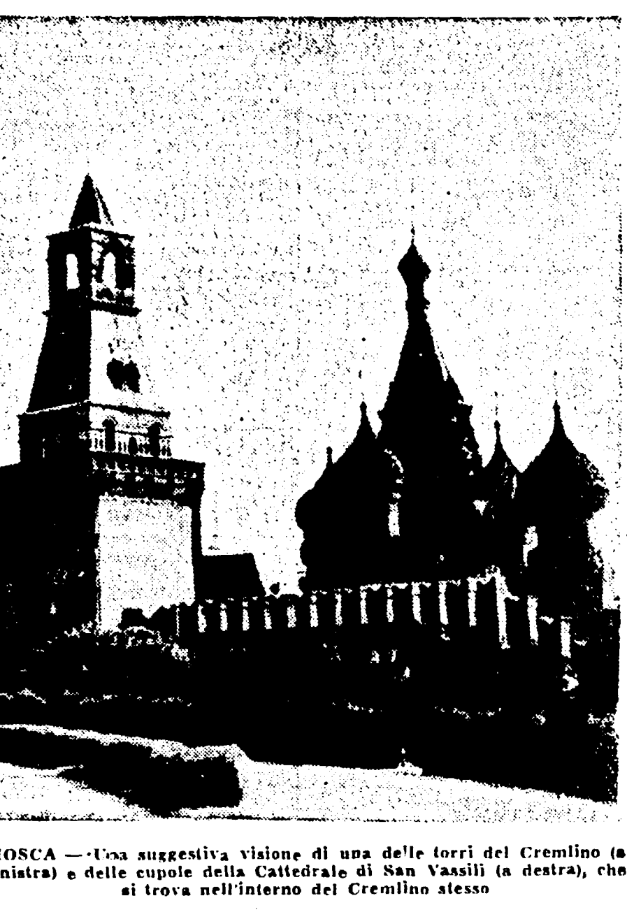
MOSCA — Una suggestiva visione di una delle torri del Cremlino (a sinistra) e delle cupole della Cattedrale di San Vassili (a destra), che si trova nell'interno del Cremlino stesso