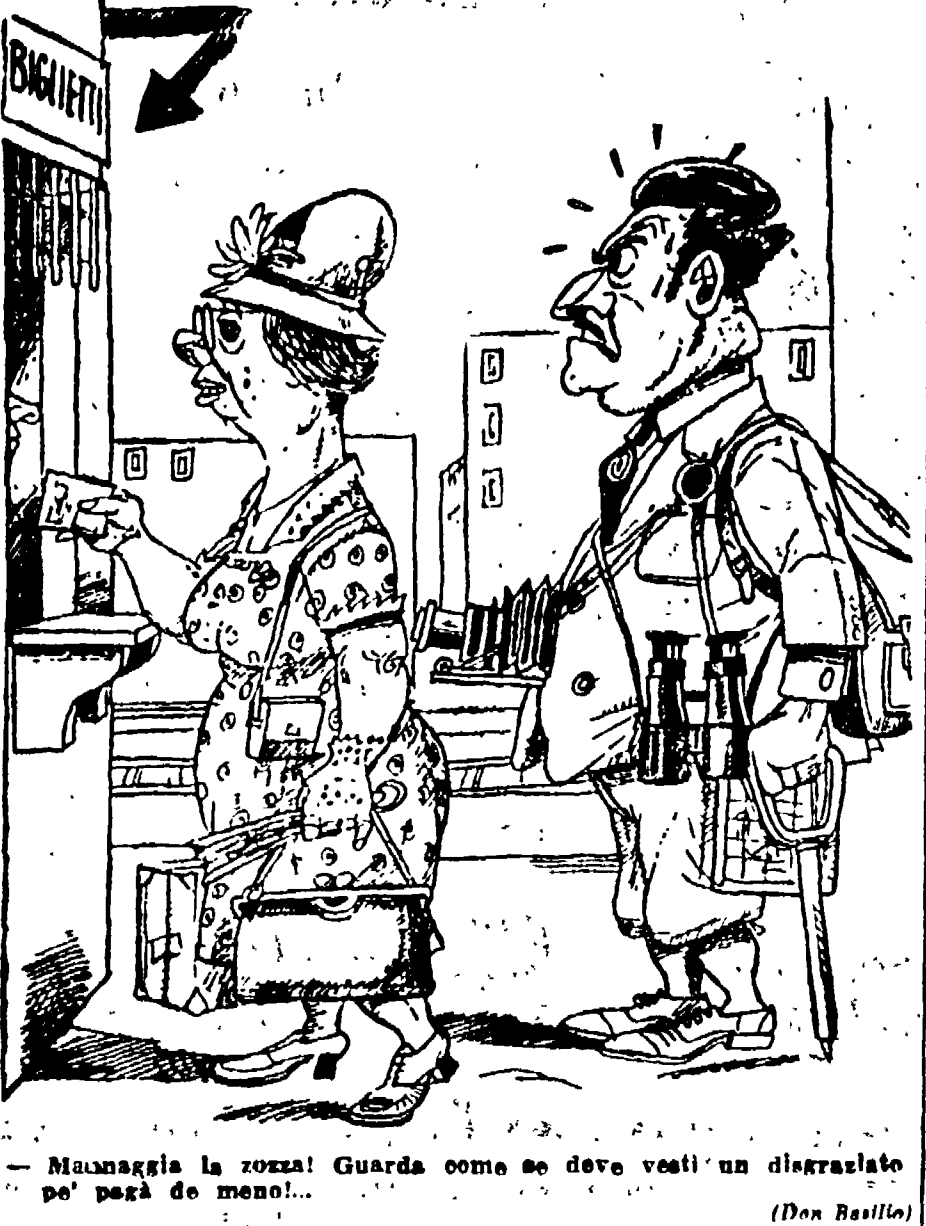
Maunaglia la zozza! Guarda come se deve vestiti un disgraziato pe' pagà de' moneti! (Don Basilio)