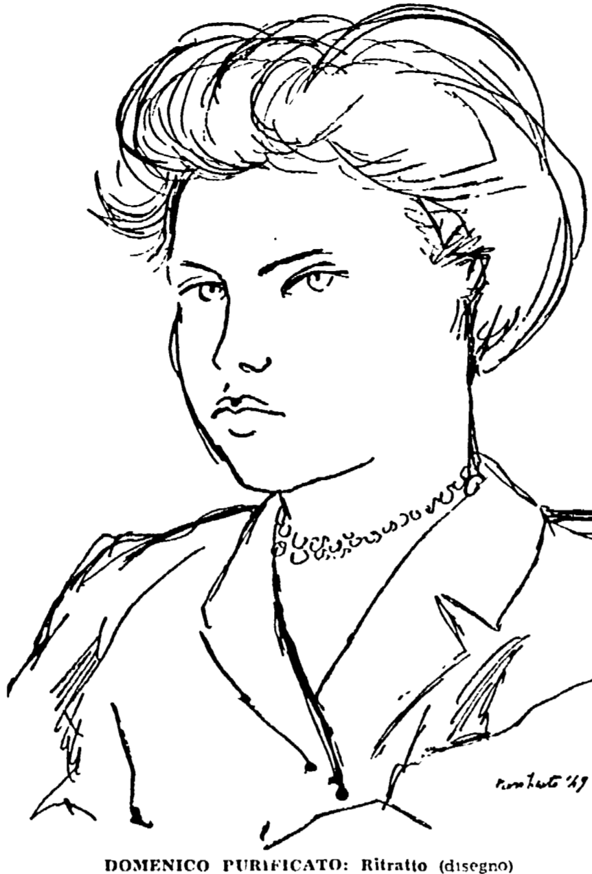
DOMENICO PURIFICATO: Ritratto (disegno)