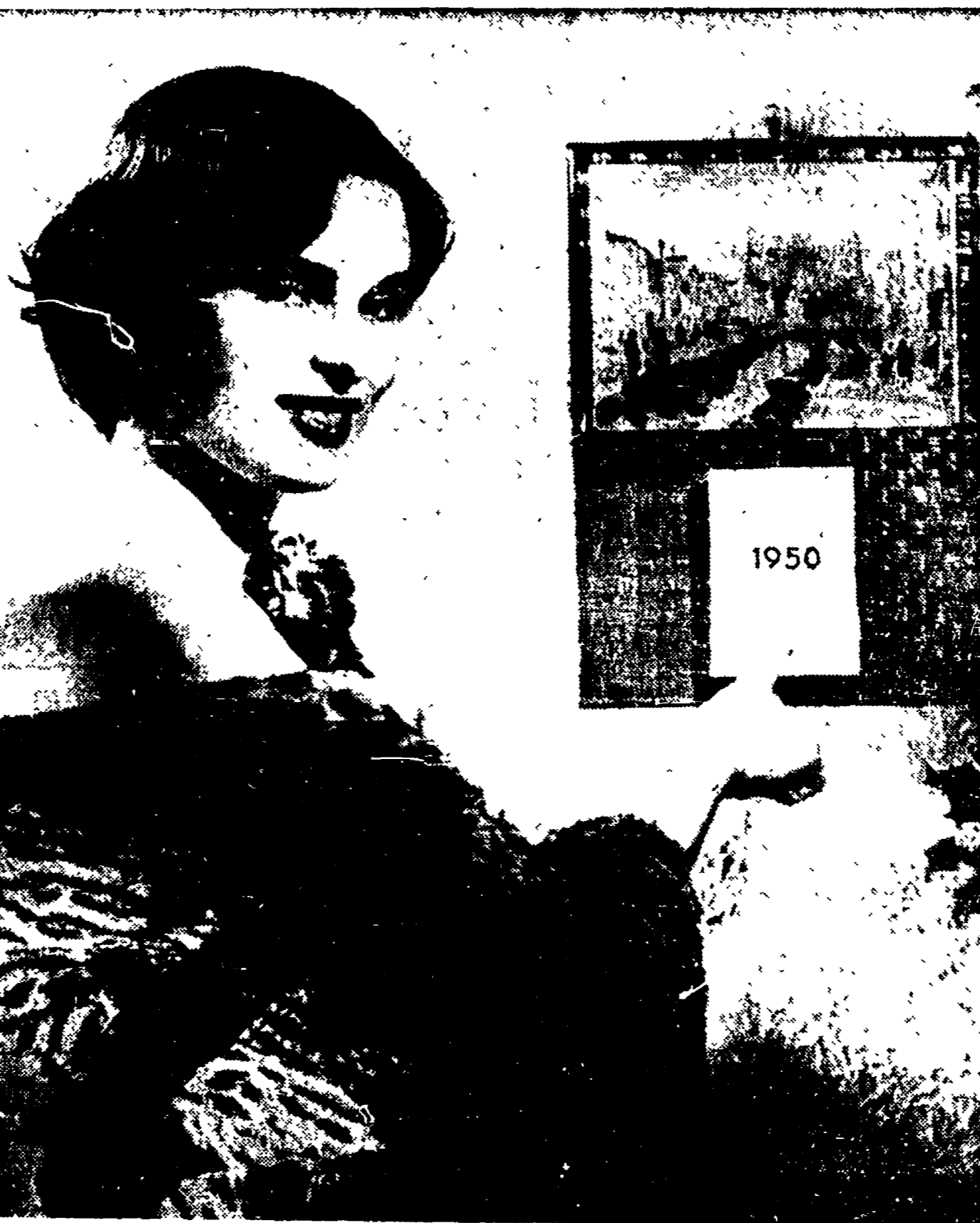
LUCIA BOSE, che nel 1948 ha interpretato per Giuseppe De Santis il film "Non c'è pace tra gli ulivi", interpreterà nel 1950 "Cronache di poveri amanti" per Luciano Visconti