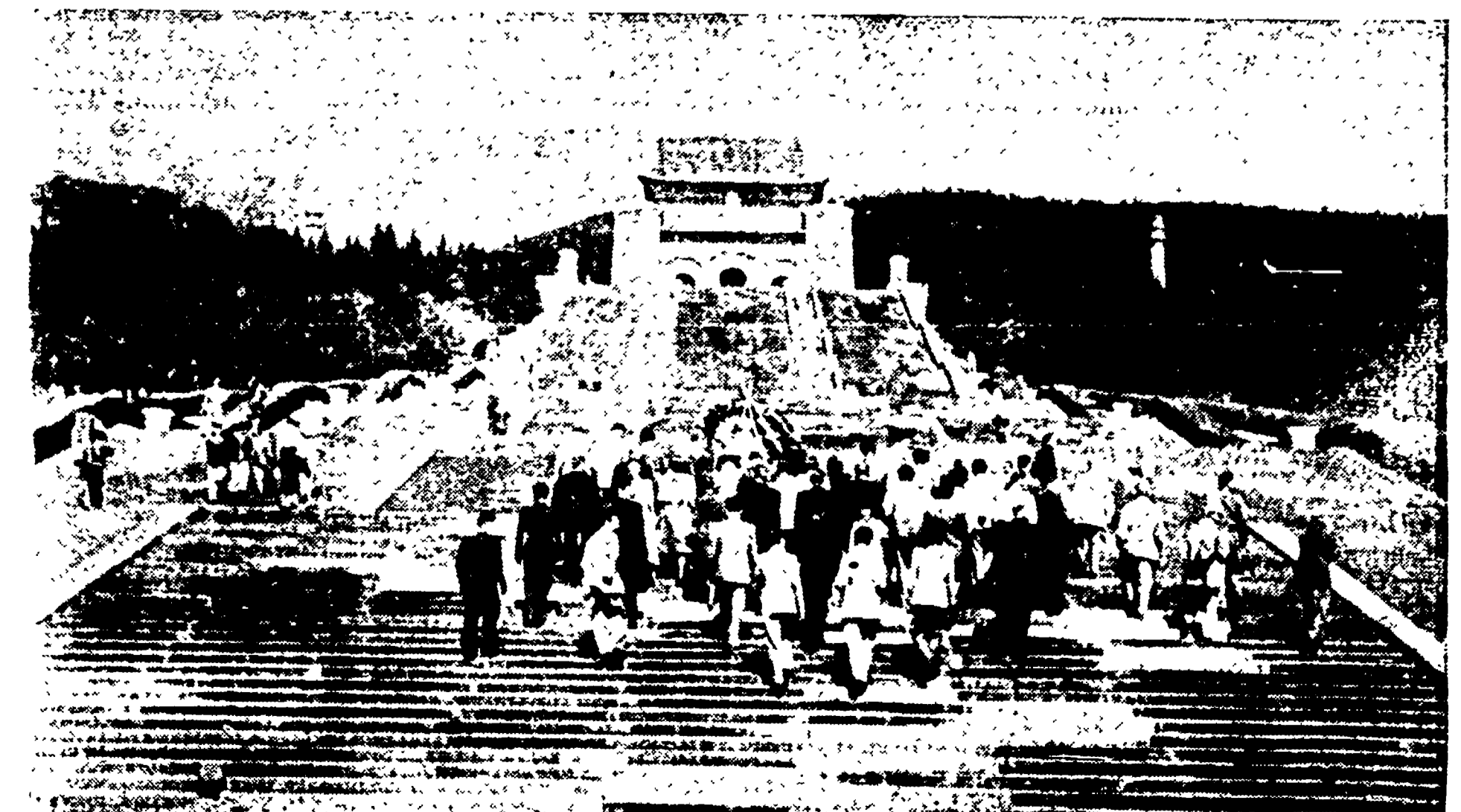
LA TOMBA DI SUN YAT SEN, il grande uomo di Stato e rivoluzionario il cui insegnamento fu tradito da Chiang Kai Shek. I comunisti mantengono la memoria di chi gettò le basi per la lotta di liberazione della Cina, condotta alla vittoria da Mao Tze Tun