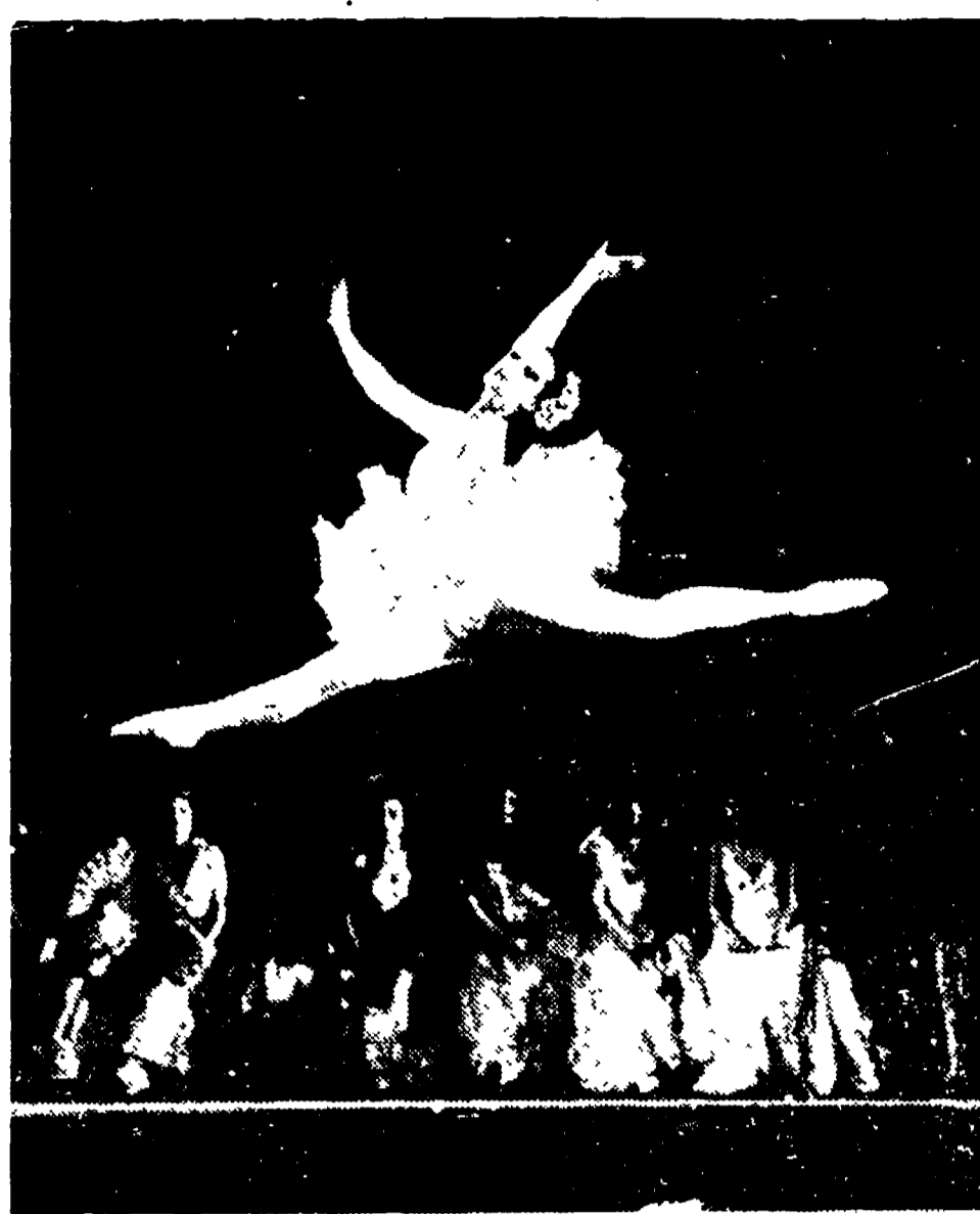
MOSCA - Grande successo ha ottenuto al Teatro dell'Opera dell'URSS il balletto «Don Chisciotte» di Minkus...