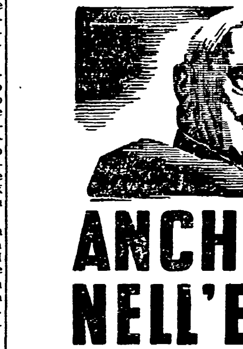
ANCHE NELL'ETA' AVANZATA

Il Segretario di Stato ha anche annunciato che i paesi atlantici hanno deciso di convocare il Consiglio atlantico a Londra per il 15 maggio. Prima di quella data Acheson si recerà a Londra, via Parigi.