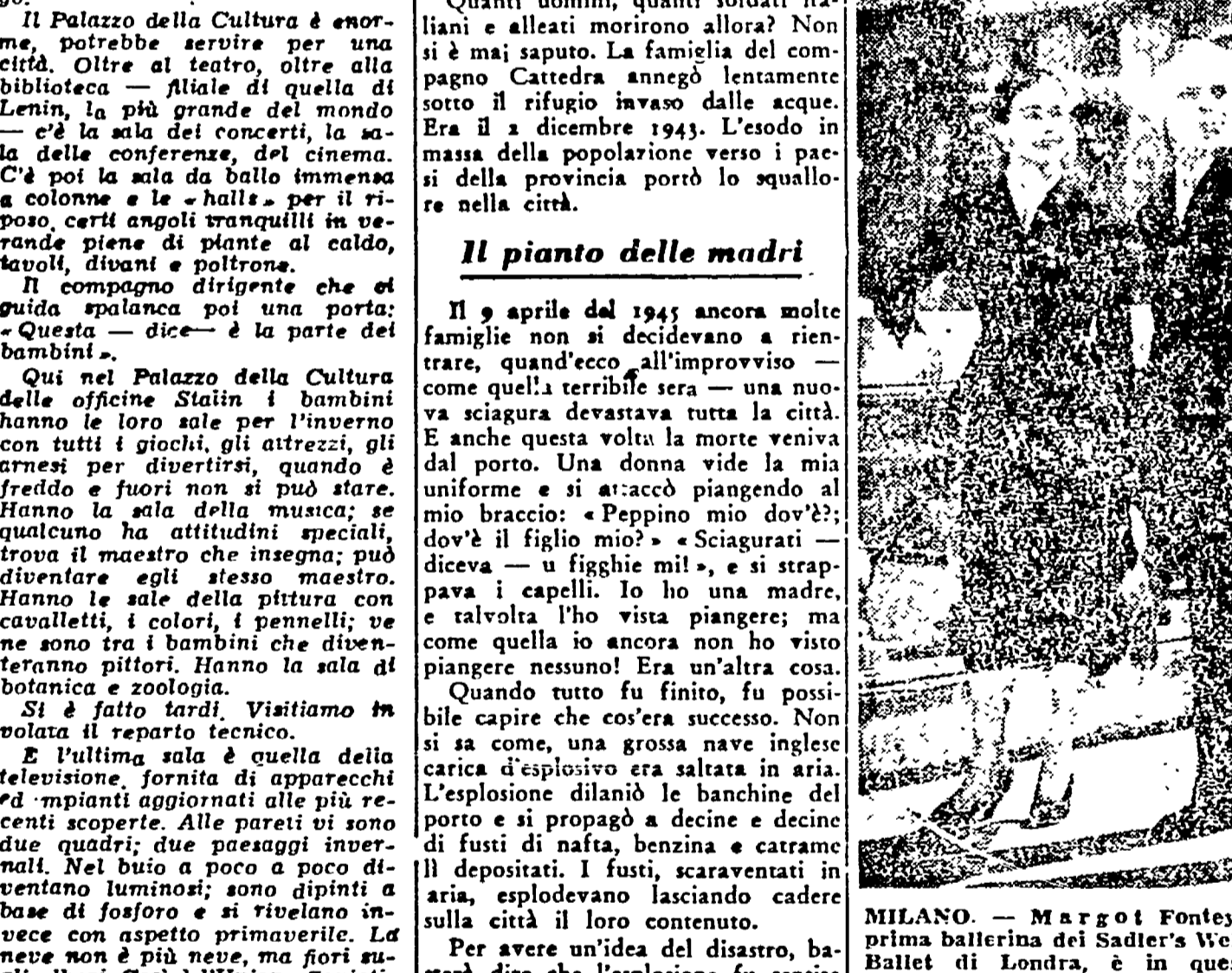
MILANO. — Margot Fonteyn, prima ballerina del Sadler's Wells Ballet di Londra...