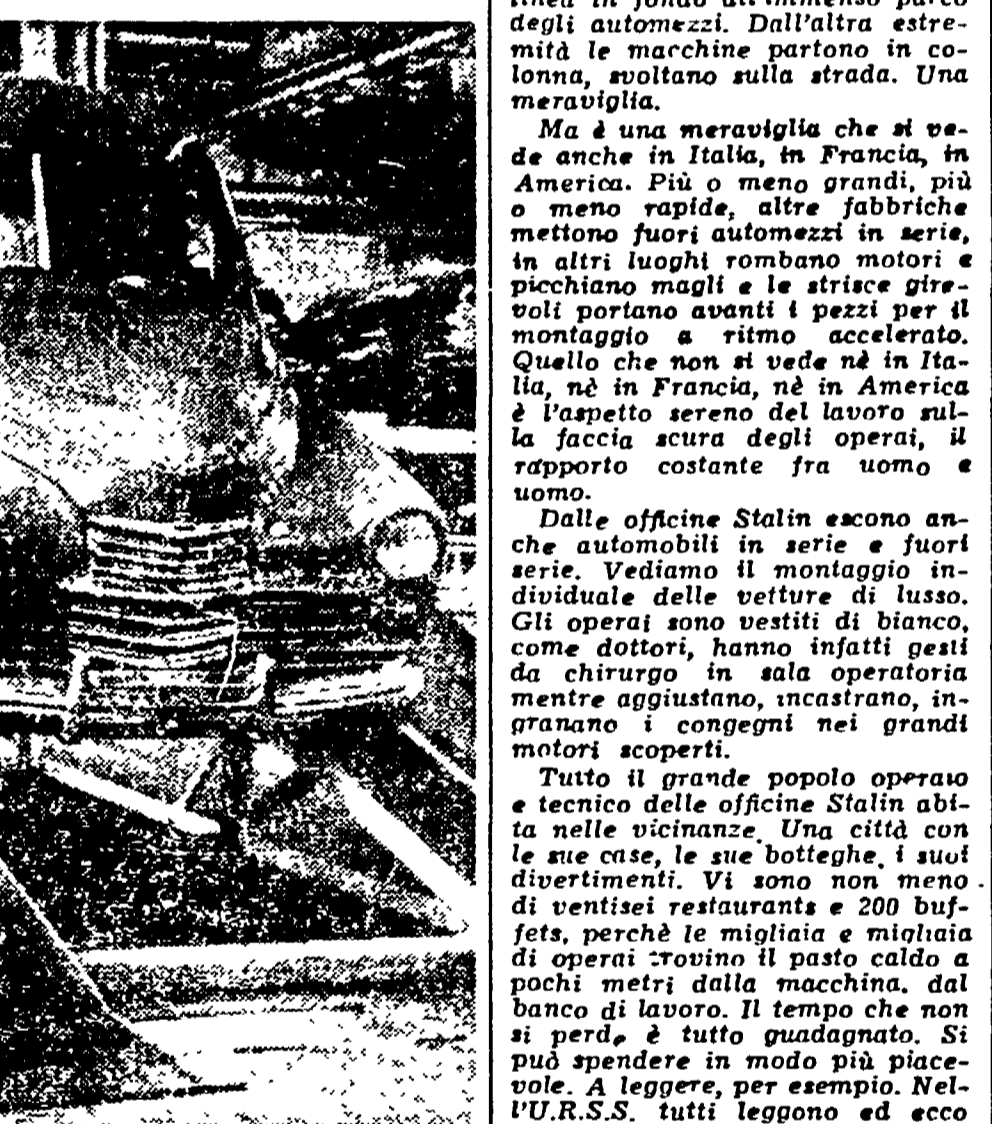
MOSCA. — Un reparto delle officine « Stalin ». La produzione automobilistica sovietica aumenta di anno in anno e migliora sempre...