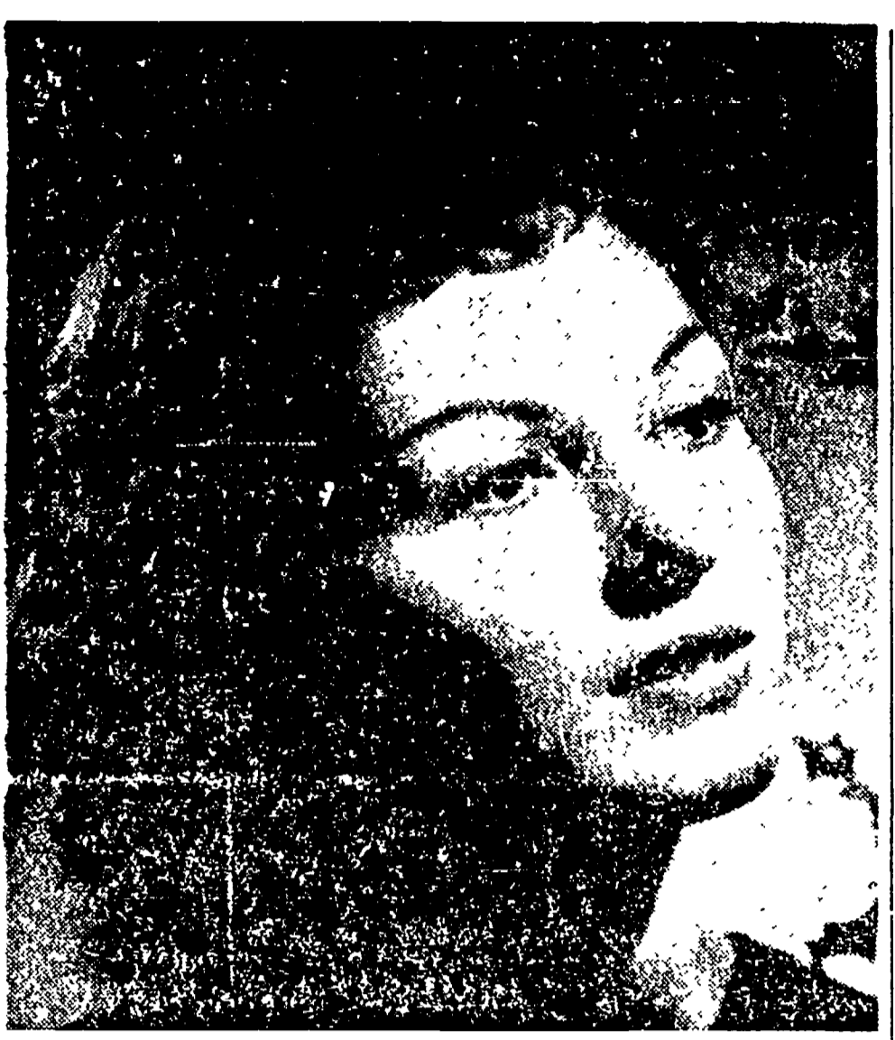
CARLA DEL POGGIO in un'immagine d'interpretazione di un nuovo film dal titolo « Luci del varietà ».