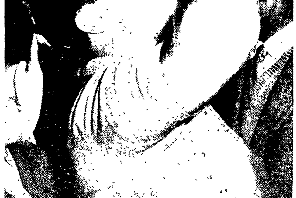
MODENA - Subito dopo la brillante vittoria conseguita nel "Gran Premio", Alberto Ascari si concede il meritato premio di una bibita.

Cuccelli-M. Del Bello hanno battuto Mottram-Paish per 9-7, 6-2 6-4 - Oggi u' time gare di singolare