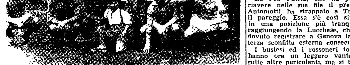
I giocatori della "Lazio", stanchi ma felici, ritratti in gruppo dopo la partita di domenica allo Stadio Centenario...

La grande vittoria del Bari sul Milan... l'imprevista sconfitta della Roma a Venezia... tutto definito (o quasi) per le piazze d'onore.