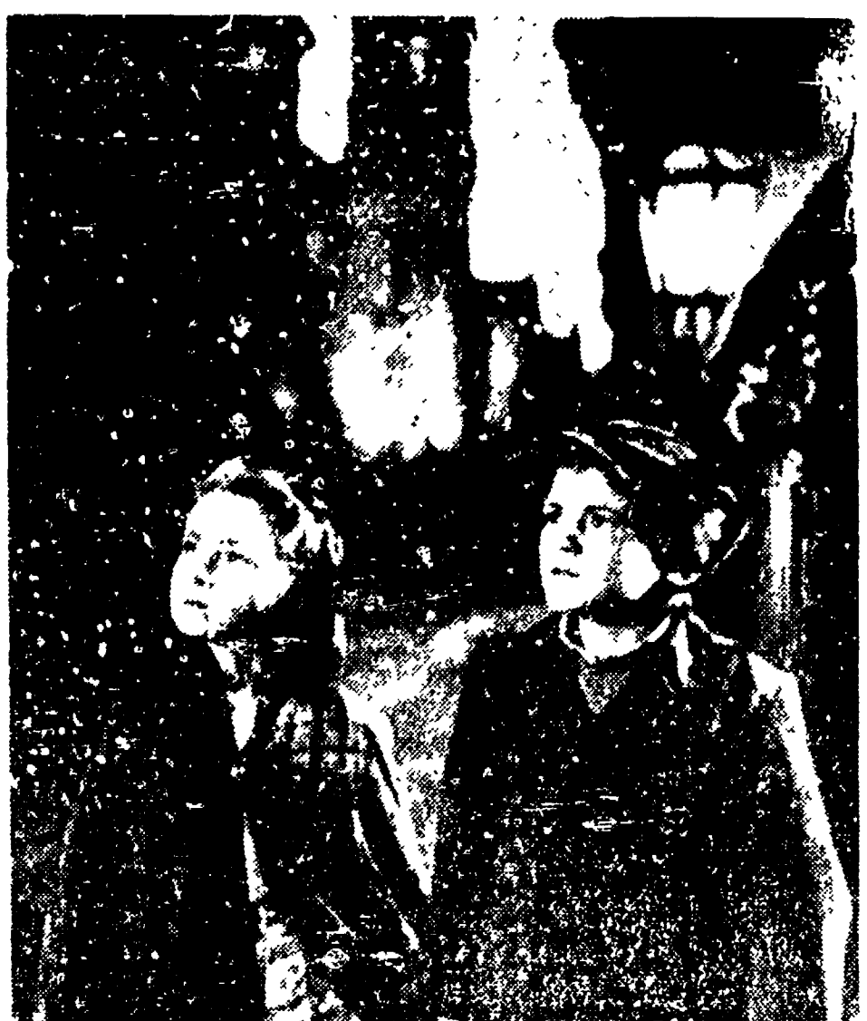
MOSCA - Fra gli ultimi film apparsi sugli schermi sovietici...