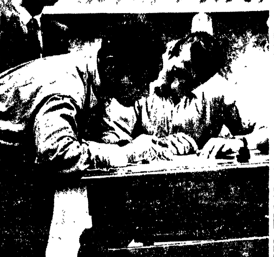
In tutti i quartieri di Roma, in questi giorni, migliaia di cittadini firmano l'appello dei Partigiani della Pace per la messa al bando della bomba atomica, arma di distruzione e di sterminio in massa. Alla Borgata e Casa Rapide (Garbatella) hanno votato 1.530 cittadini e cioè il 98% della popolazione