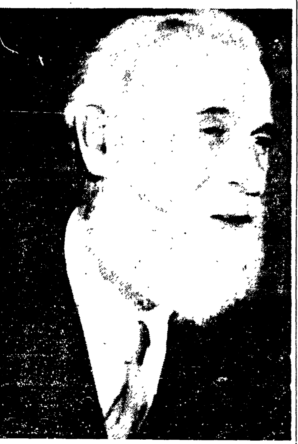
ENRICO PEA, il noto scrittore ligure, autore di numerosi romanzi ha sottoscritto l'appello di Stoccolma per l'interdizione dell'atomica