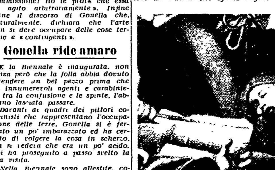
RENATO GUTUSO: «L'occupazione delle terre incolte» (particolare)

« Questa mattina la laguna davanti alla Riva degli Schiavoni e in grande animazione: la motovox con le bandiere tricolori solcano l'acqua, una corolla di bambini s'indugiano su canottoli come agli... »