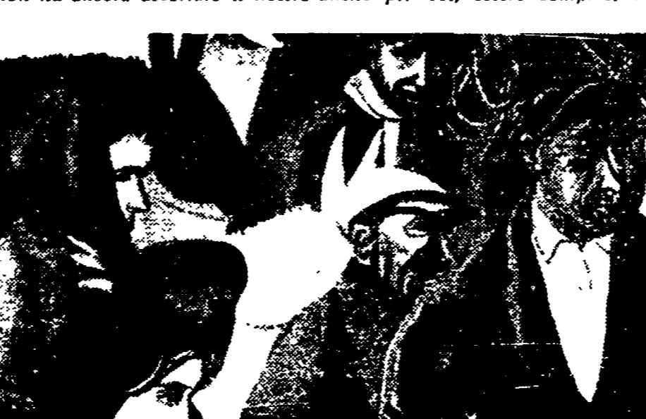
RENATO GUTUSO: «L'occupazione delle terre incolte» (particolare)