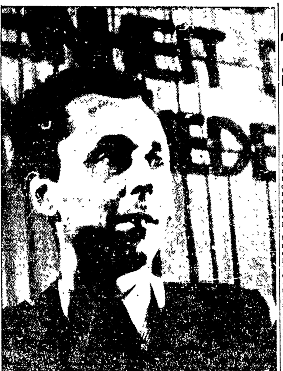
BERLINO. - John Peet, direttore dell'Agenzia "Reuters" per Berlino, fotografato durante la conferenza stampa nel corso della quale ha annunciato la sua decisione di chiedere asilo alla Repubblica democratica, prendendo posto anch'egli nel fronte dei popoli per la pace (Telefoto).

A capo della delegazione italiana che parteciperà alla conferenza per il cartello franco-tedesco del carbone e dell'acciaio, sarà l'on. Paolo Emilio Taviani.