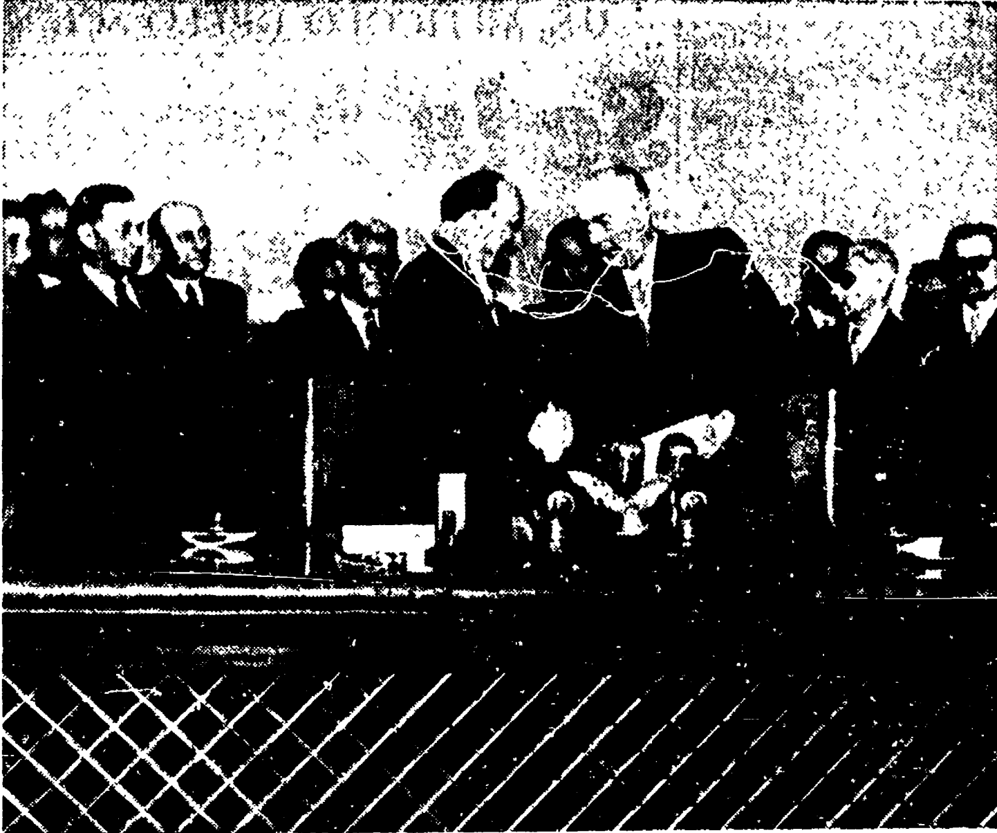
VARSAVIA - La firma degli accordi fra la nuova Germania democratica e la Repubblica di Polonia per la definitiva sistemazione della linea di confine...

Americani a Tokio Il quotidiano francese «Le Monde» pubblica, in una corrispondenza da Washington, interessanti indiscrezioni sulla visita dei capi militari americani a Tokio.