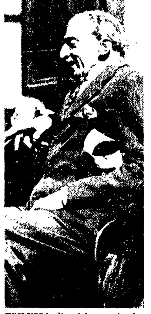
TRILUSSA, il celebre poeta, ha aderito al convegno degli intellettuali, che si terrà martedì al Teatro delle Arti, per la difesa della cultura contro la minaccia atomica.