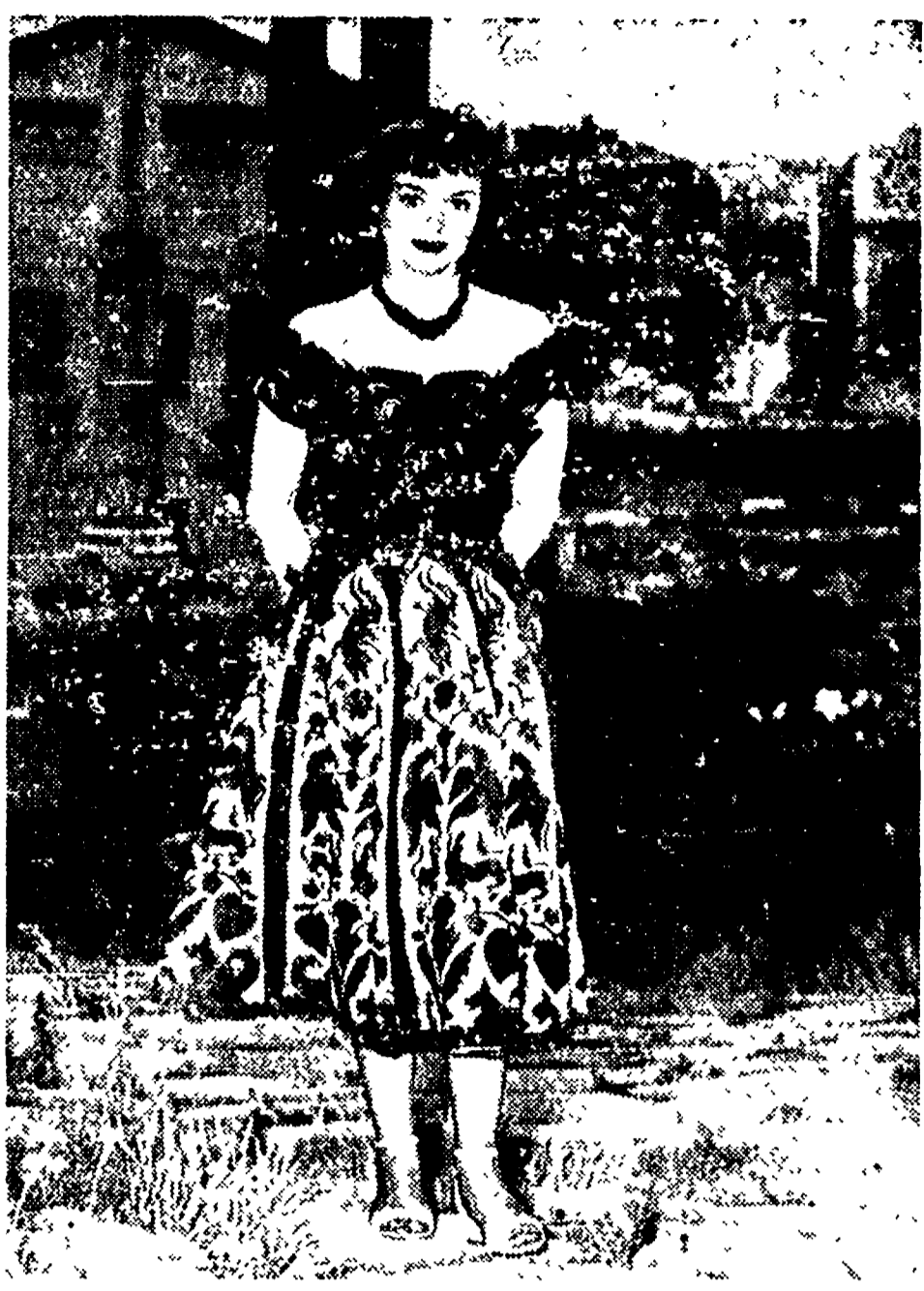
SIMONE SIMON, la graziosa attrice francese, che ultimamente è stata in Italia per interpretare il film «Donne senza nome»...