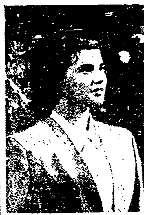
Un operaio metallurgico e una maestra sono gli interpreti principali del film «La caduta di Berlino»...