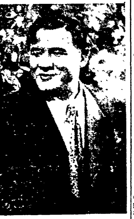
Un operaio metallurgico e una maestra sono gli interpreti principali del film «La caduta di Berlino»...

È importante osservare che nessuno ha mai creduto necessario aggiungersi la chiesa di un altro: «Non acciderli».