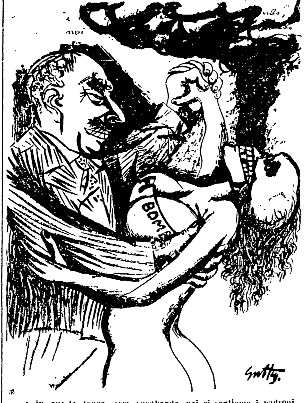
...e in questo luogo, così vagabondo, noi ci sentiamo i padroni del mondo...