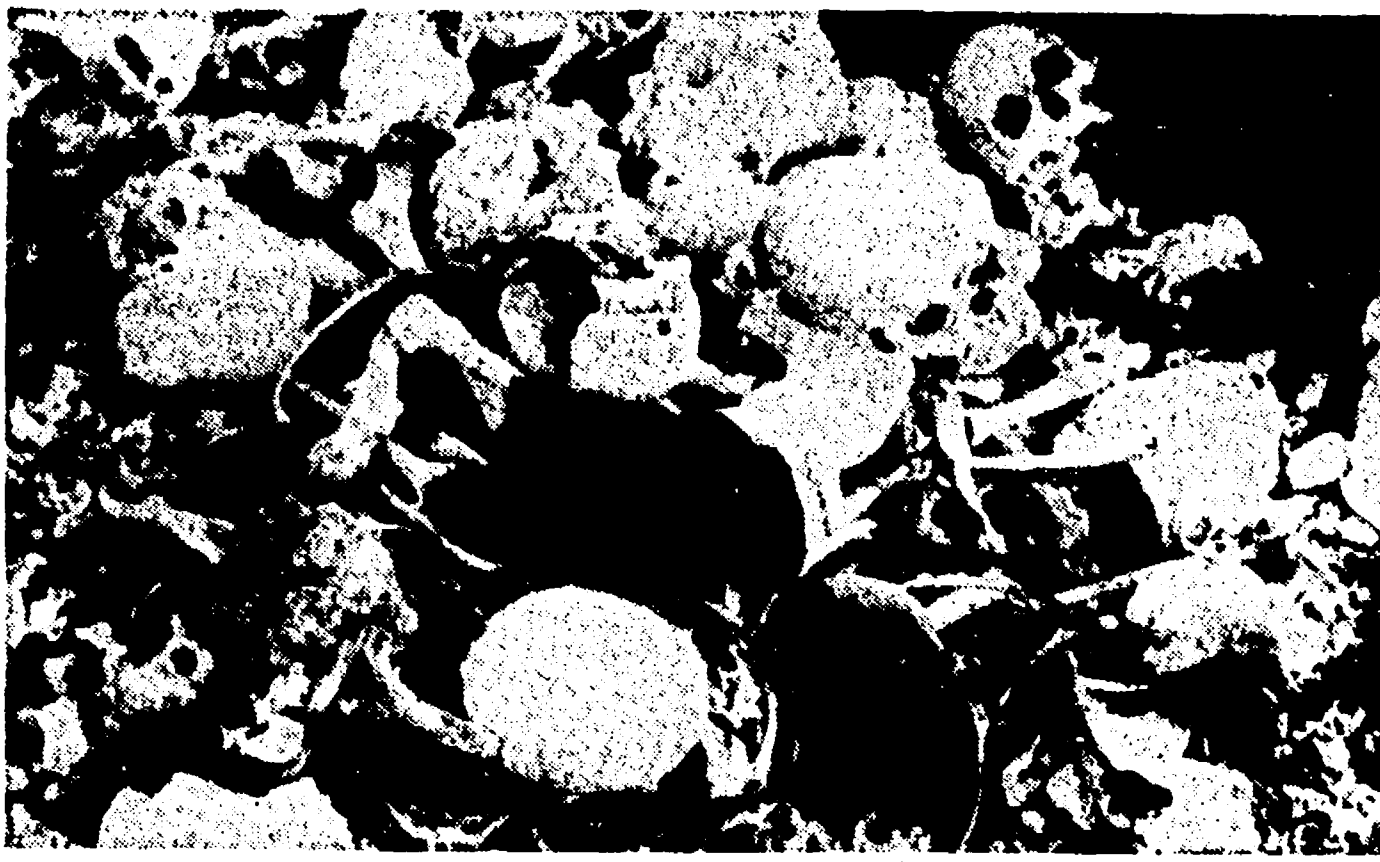
Una ferrileggiante documentazione: i resti insepolti di soldati e ufficiali della Divisione Acqui

«Gli italiani non hanno stomaco per combattere: questo il giudizio che Eisenhower, l'attuale gauleiter americano per l'Europa, diede, nel suo libro «Crociata in Europa»...»