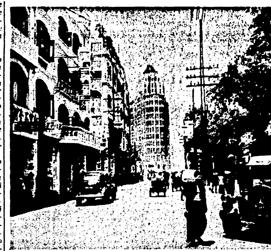
Visione mattutina di una via di Canton