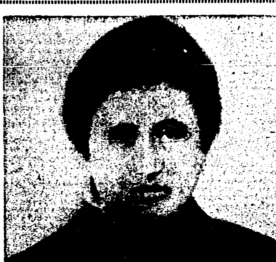
Il 16 gennaio 1919 Rosa Luxemburg, dirigente del movimento operaio tedesco, uccisa a Berlino.