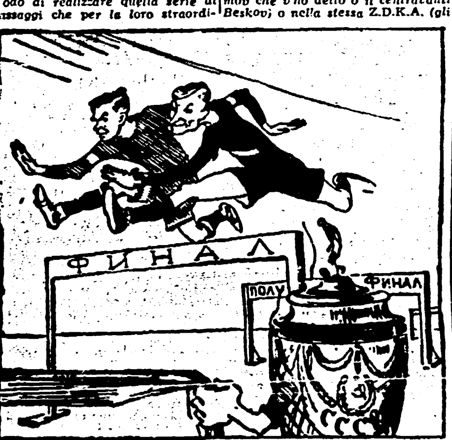
Dopo la vittoria dello «Spartak» sulla «Z.D.K.A.» un giornale sovietico carica contro il «Dinamo» e contro «Spartak», «Beskov» e «Beskov», in atto di unire l'ultimo «centro» (Spartak) per conquistare la «Coppa dell'U.R.S.S.»

Nello Spartak mi colpì soprattutto il gioco della prima linea. Gli uomini della squadra moscovita sono famosi quanto altri che militano nella Dinamo (oltre che Trofimov che v'ho detto o i centranti Beskov) o nella stessa Z.D.K.A. (gli