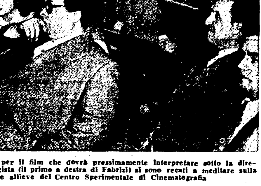
ALDO FABRIZI cerca «una figlia» per il film che dovrà prossimamente interpretare...