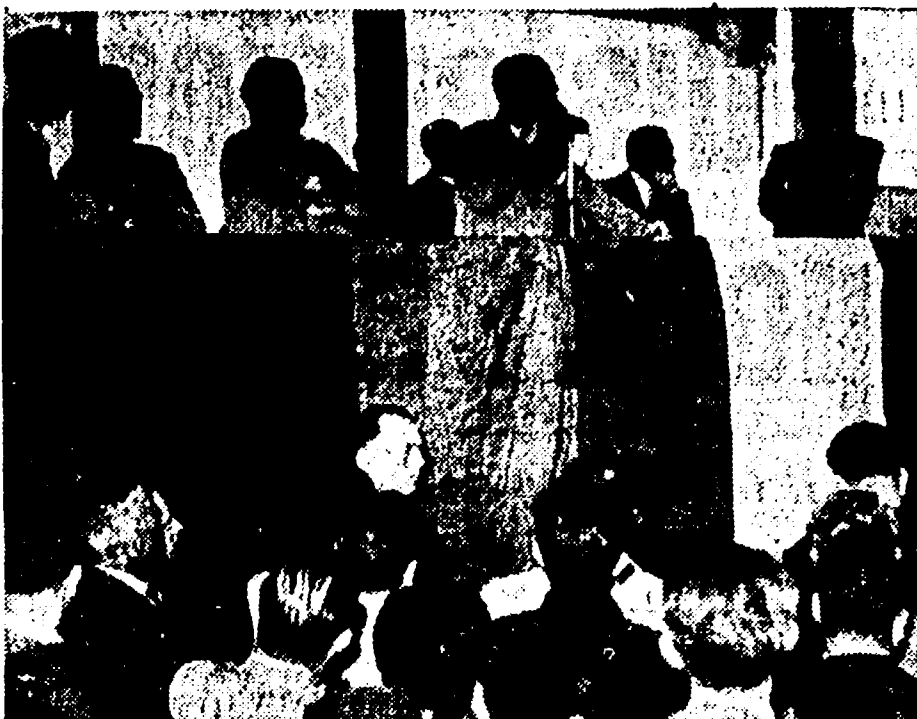
Ieri pomeriggio, nella rimessa di San Giovanni, i dirigenti sindacali hanno comunicato ad alcuni migliaia di tranvieri liberi dal servizio il punto della situazione: all'unanimità è stata decisa la ripresa della lotta

Stanno effettivamente al colmo della sopportazione: lo sono i lavoratori autoferrari e i lavoratori dei servizi