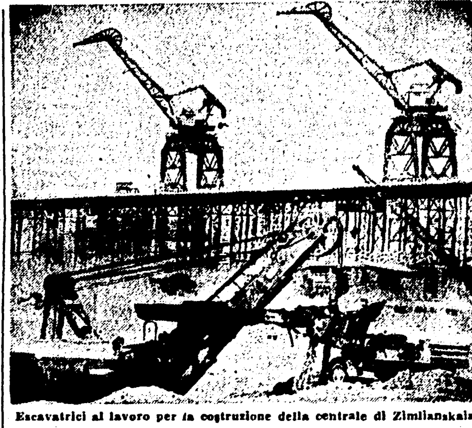
Eccavatori al lavoro per la costruzione della centrale di Zimlanakala

regioni che vanno dal Montana ai degli Stati Uniti. Ma nell'U.R.S.S., fin dai primi anni di vita, il regime sovietico ha dichiarato guerra al deserto, di far fronte alle terribili tempeste di sabbia del Kansas, del Colorado, del Nuovo Messico e dell'Oklahoma. La carestia e i cattivi raccolti si ripetono regolarmente ogni tre anni. Sono queste le ragioni di un così tragico impoverimento del suolo, che le teorie pseudo-scientifiche sullo «inlettabilità» declino della fertilità della terra non riescono a spiegare.