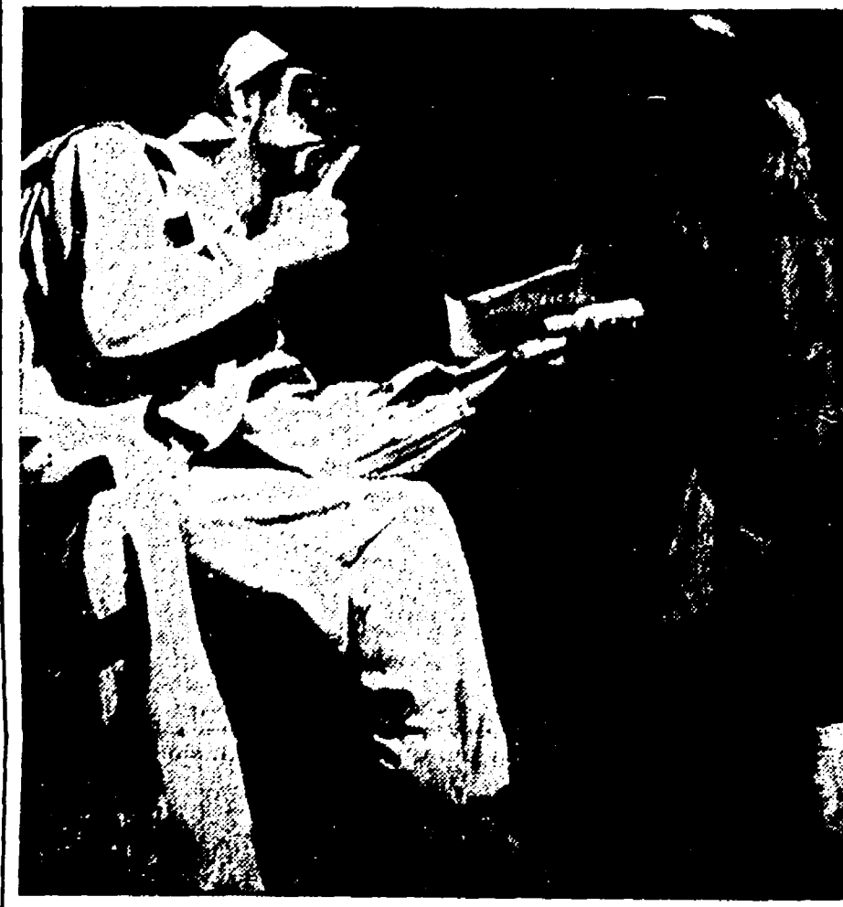
Il governo democristiano, che non ha frenato il suo appoggio alla esecuzione di alcune commedie anticomuniste e di magagnolenti drammi...