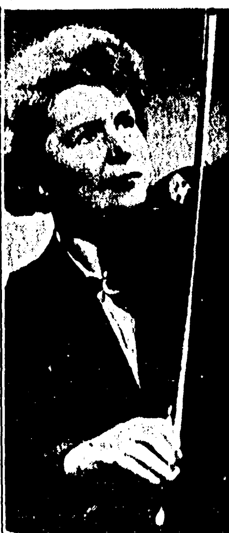
GALINA BARINOVA, l'illustre violinista sovietica, che prenderà parte, insieme con gli altri artisti dell'U.R.S.S. attualmente in Italia, alle manifestazioni del Maggio fiorentino