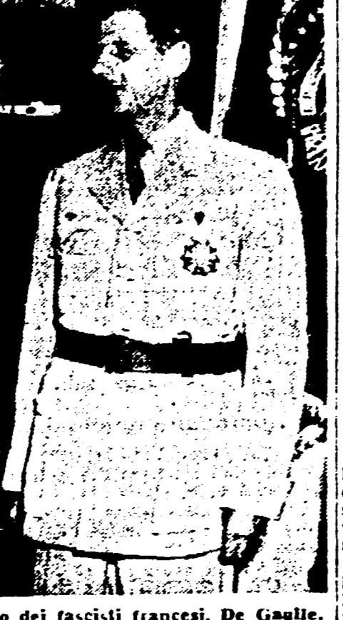
Un'eco profonda in tutta la Francia, denunciano con vigore il golismo come l'edizione francese attuale del fascismo...