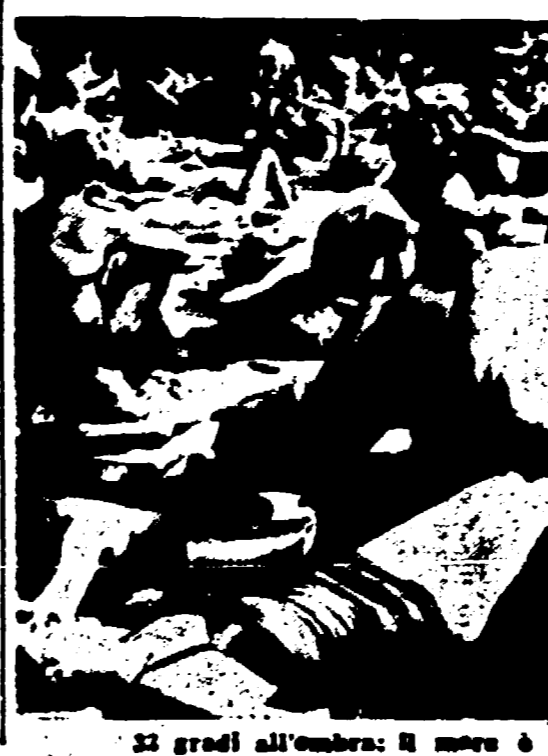
32 gradi all'ombra: il mare è una grande attrattiva