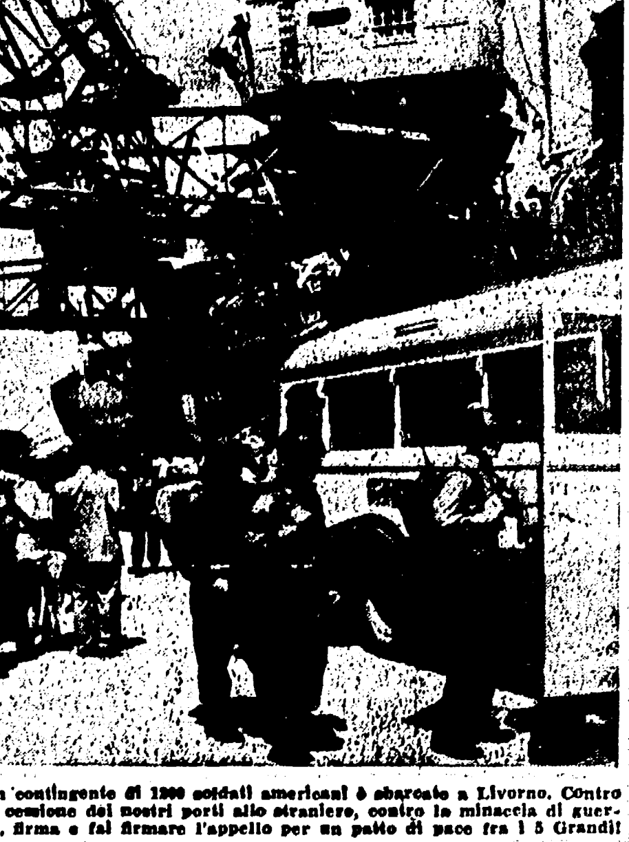
Un contingente di 1000 soldati americani è sbarcato a Livorno. Contro la cosetta dei nostri porti allo straniero, contro la minaccia di guerra, firma e fai firmare l'appello per un patto di pace fra i 5 Grandi