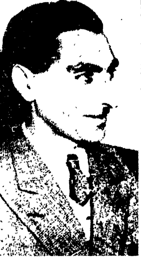
Gavam Saltaneh, il massacratore di Tabriz

La storia del partito Tudeh è una storia di gloria e di eroismo. Noi conosciamo le gesta dei governi capitalisti contro i movimenti popolari, ma non abbiamo l'idea della ferocia con cui gli imperialisti nelle colonie loro soggette si sono battuti contro i movimenti popolari. Teheran è piena ancora oggi dei rifugiati dell'Azerbajan. Abitano in buie tane, in cunicoli sotterranei al sud della città e vi hanno formato come un grande villaggio di miseria. I bambini vivono mangiando le erbe selvatiche che nascono sotto gli alberi e ogni albero appartiene ad un gruppo di bambini che entrano in lotta sanguinosa tra loro per difendere le poche foglie dagli altri affamati. Nel 1946 l'Azerbajan, la zona nord della Persia che confina con l'Azerbajan sovietico, si era dato un governo di sinistra, ma gli americani affermando la sua unità con la patria persiana e l'integrità della nazione persiana. Ma gli anglo-americani, furibondi per questo esperimento di governo democratico, si sono battuti contro il popolo persiano, affermando la sua unità con la patria persiana e l'integrità della nazione persiana. Ma gli anglo-americani, furibondi per questo esperimento di governo democratico, si sono battuti contro il popolo persiano, affermando la sua unità con la patria persiana e l'integrità della nazione persiana.