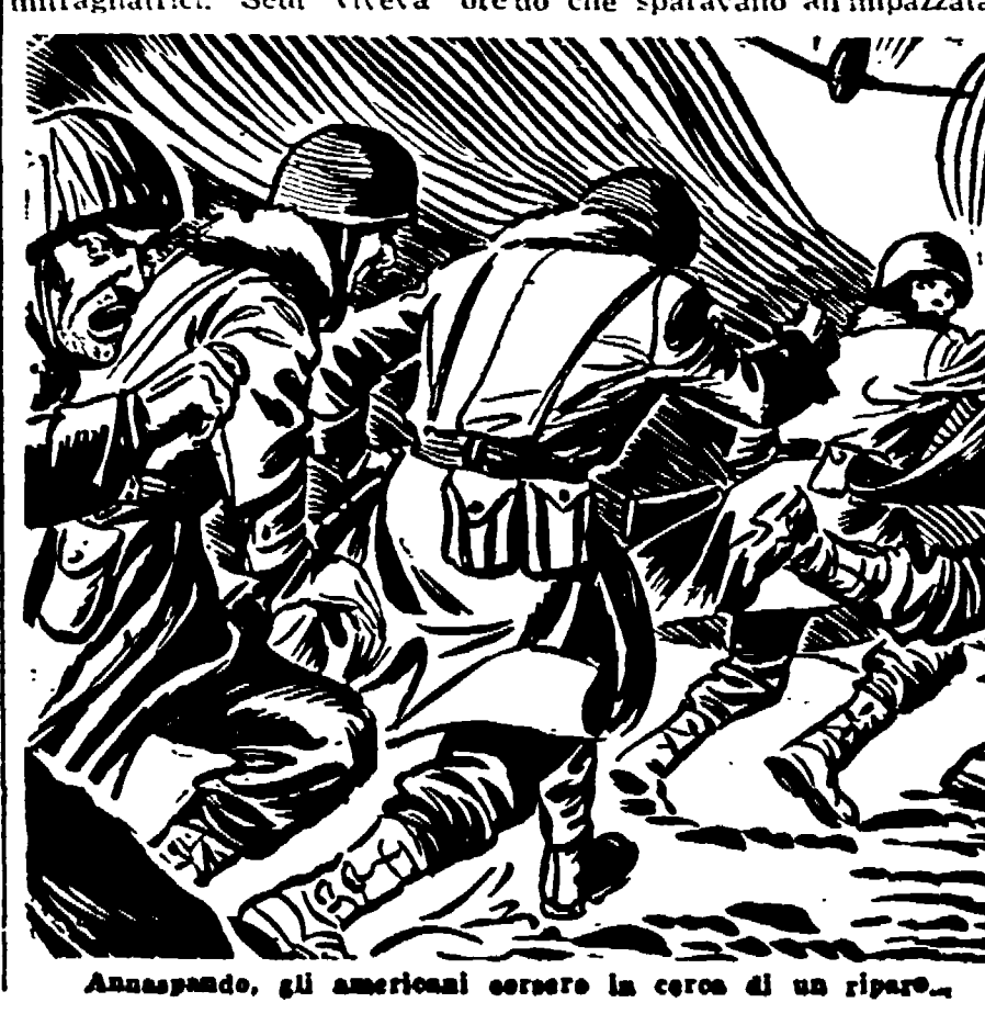
Anzappando, gli americani corsero in cerca di un riparo.