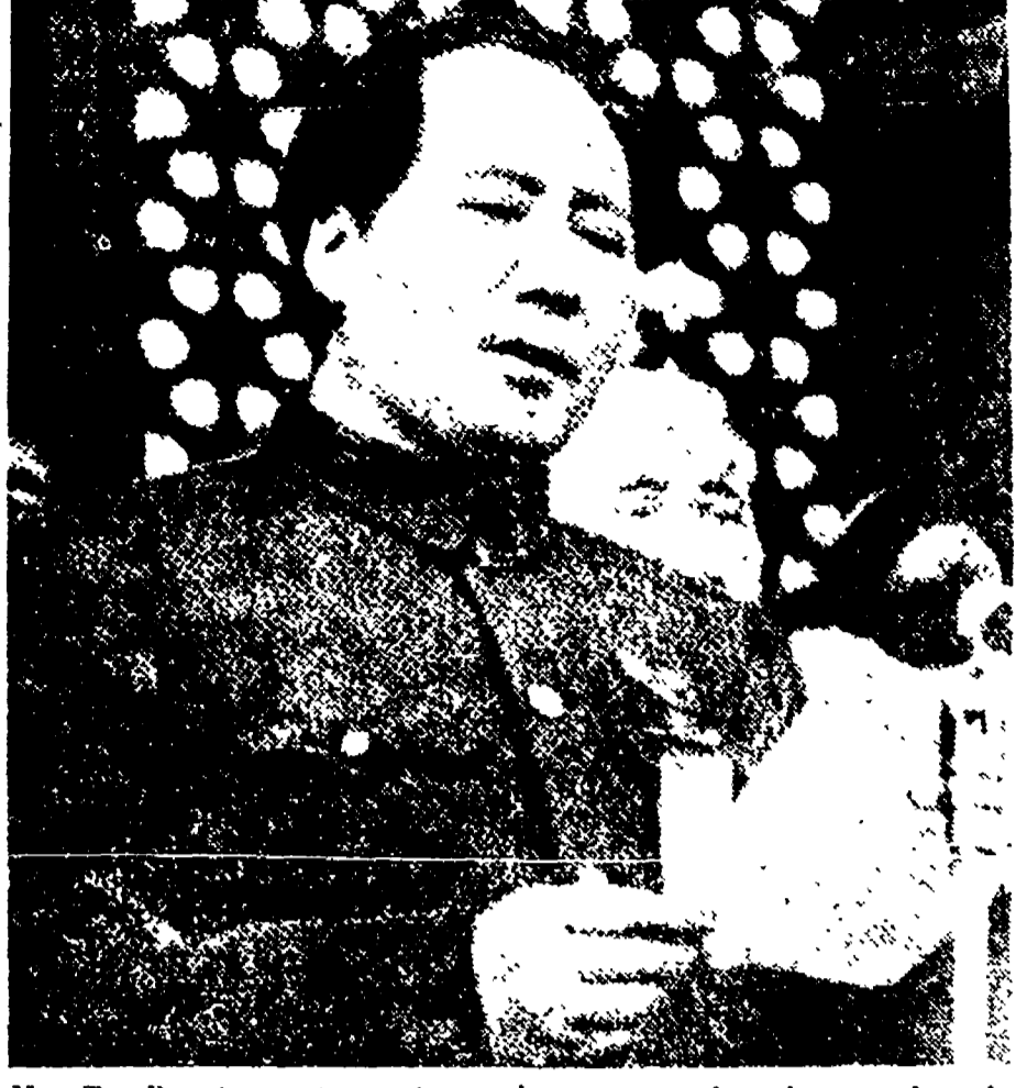
Mao Tse Dun fotografato nello storico momento in cui annunciava la fondazione della Repubblica popolare cinese