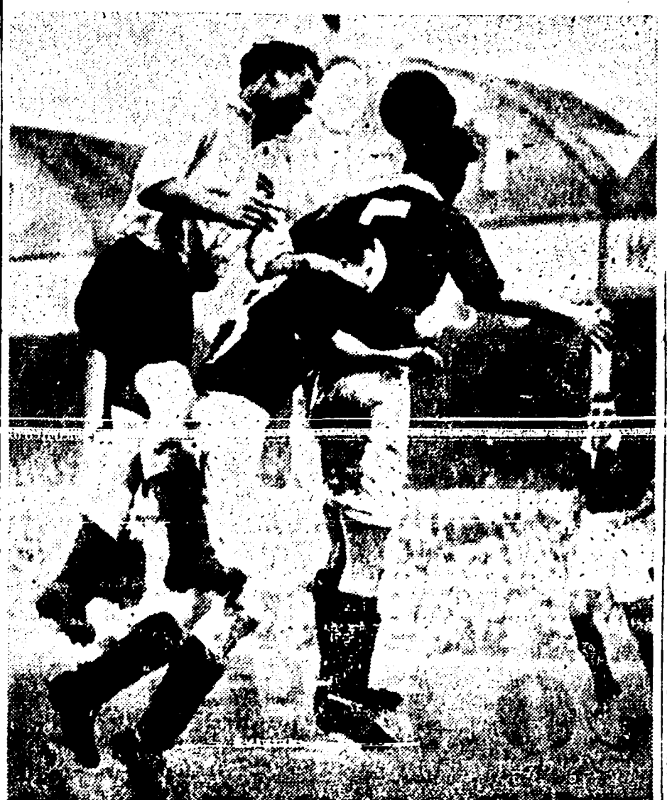
INGHILTERRA-IRLANDA 2-0 - Da quando l'anziano Lawton (il fiore d'Inghilterra) non veste più la maglia bianca, gli inglesi hanno sempre cercato il nuovo centravanti per la nazionale; e, dopo le delusioni dei vari Rowley e Milburn, sembra che l'abbiano trovato in Lofthouse, autore delle reti agli irlandesi, che qui vediamo contendere una palla a Vernon e Mc Michael. Ma la nazionale bianca va sempre alla ricerca di due mezzali di vaglia.

I TECNICI DELLA NAZIONALE INGLESE SONO PREOCCUPATI PER L'INCONTRO DEL 28