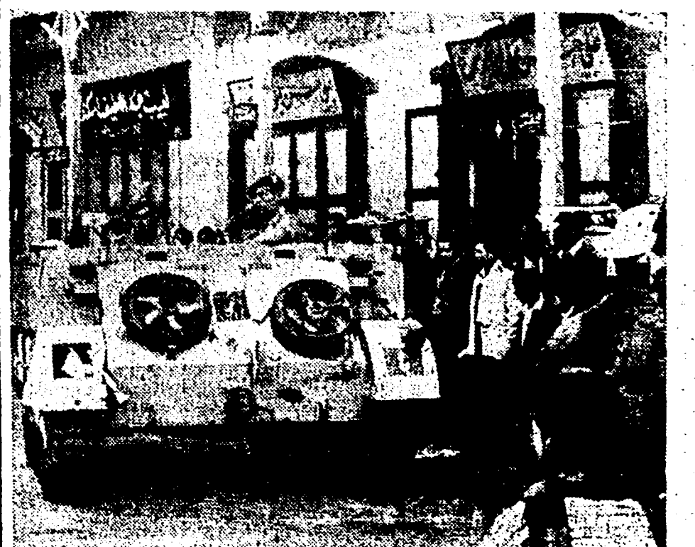
ISMAILIA - Per le vie della città passano i carri armati dell'invaseore, seguiti dagli sguardi carichi di odio e di disprezzo degli egiziani... (text continues)

...salandoli di sorpresa; poi hanno cominciato a penetrare nei negozi... (text continues)