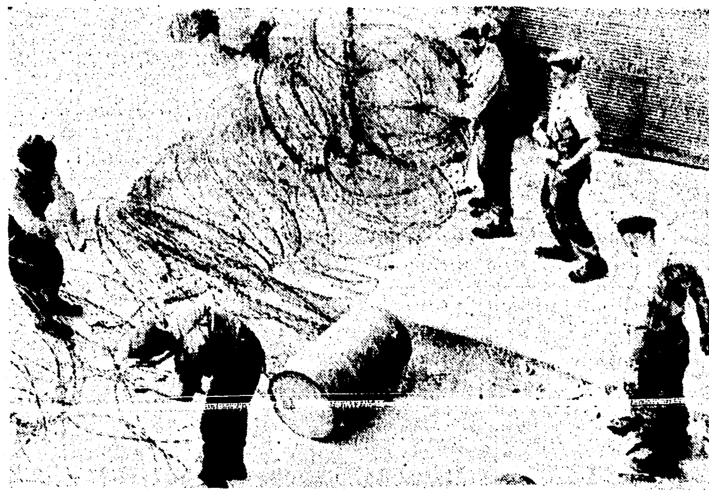
ISMAILIA - Gli inglesi hanno occupato la città egiziana, disponendo in ogni strada fili spinati, mitragliatrici e soldati in un vero stato di assedio... (text continues)

Negozi arabi assaltati dalle truppe d'occupazione - A colloquio con il vice governatore della "zona del canale,"