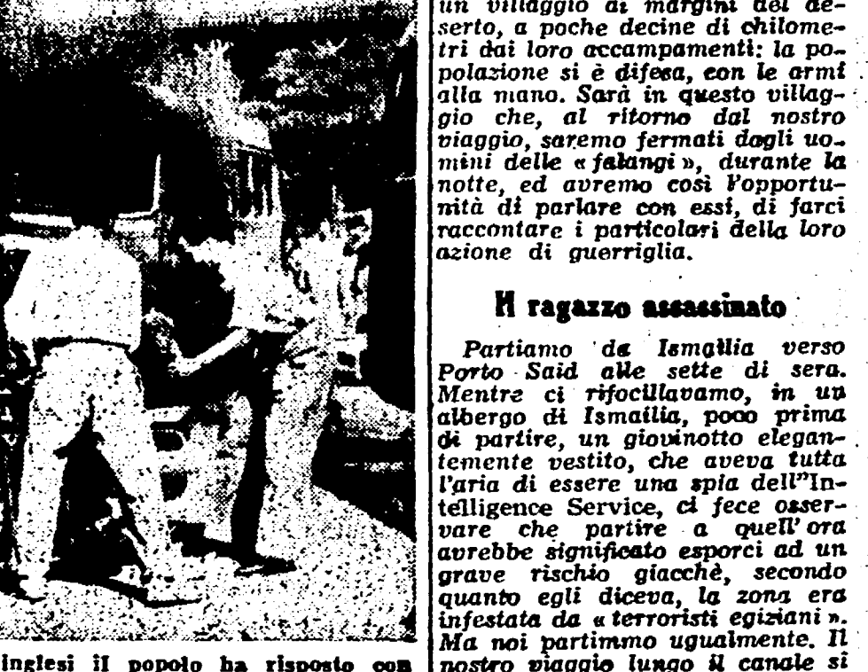
ISMAILIA - Alle provocazioni inglesi il popolo ha risposto con l'azione. Ecco una vettura britannica incendiata dai patriotti... (text continues)

Il Vice governatore della "zona del canale", che il nostro inviato ha potuto avvicinare durante il nostro soggiorno ad Ismailia, ci ha raccontato altri particolari sul modo bestiale di procedere degli inglesi. Essi si recano presso l'autorità egiziana e chiedono... (text continues)