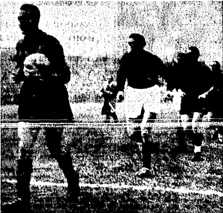
BARTALI E COPPI CALCIATORI - Domenica all'Arena di Milano...