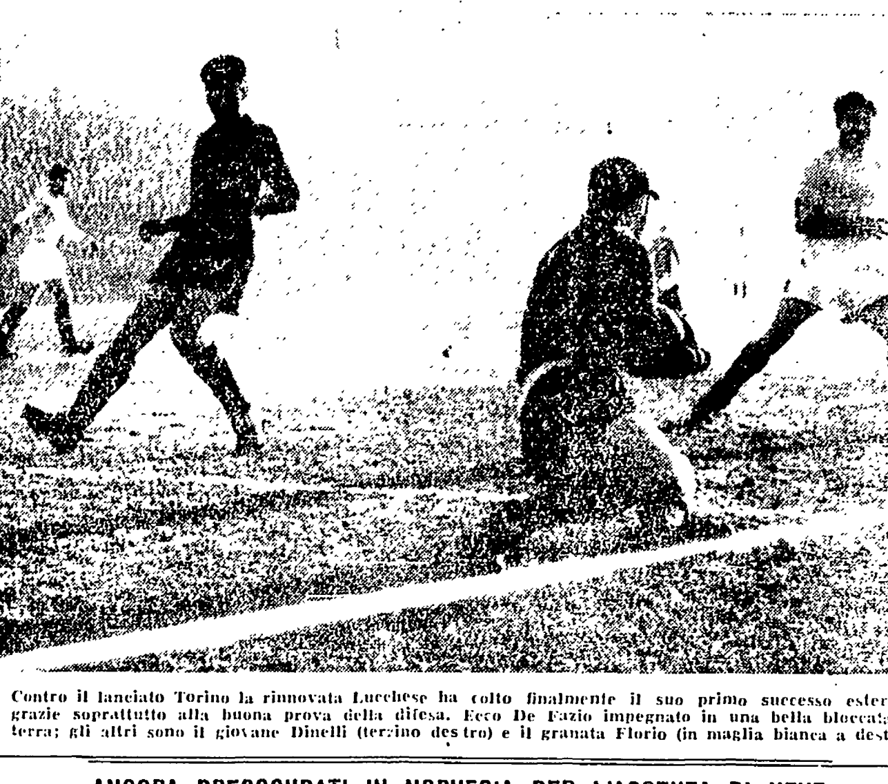
Contro il lanciato Torino la rinnovata Luchese ha colto finalmente il suo primo successo esterno...