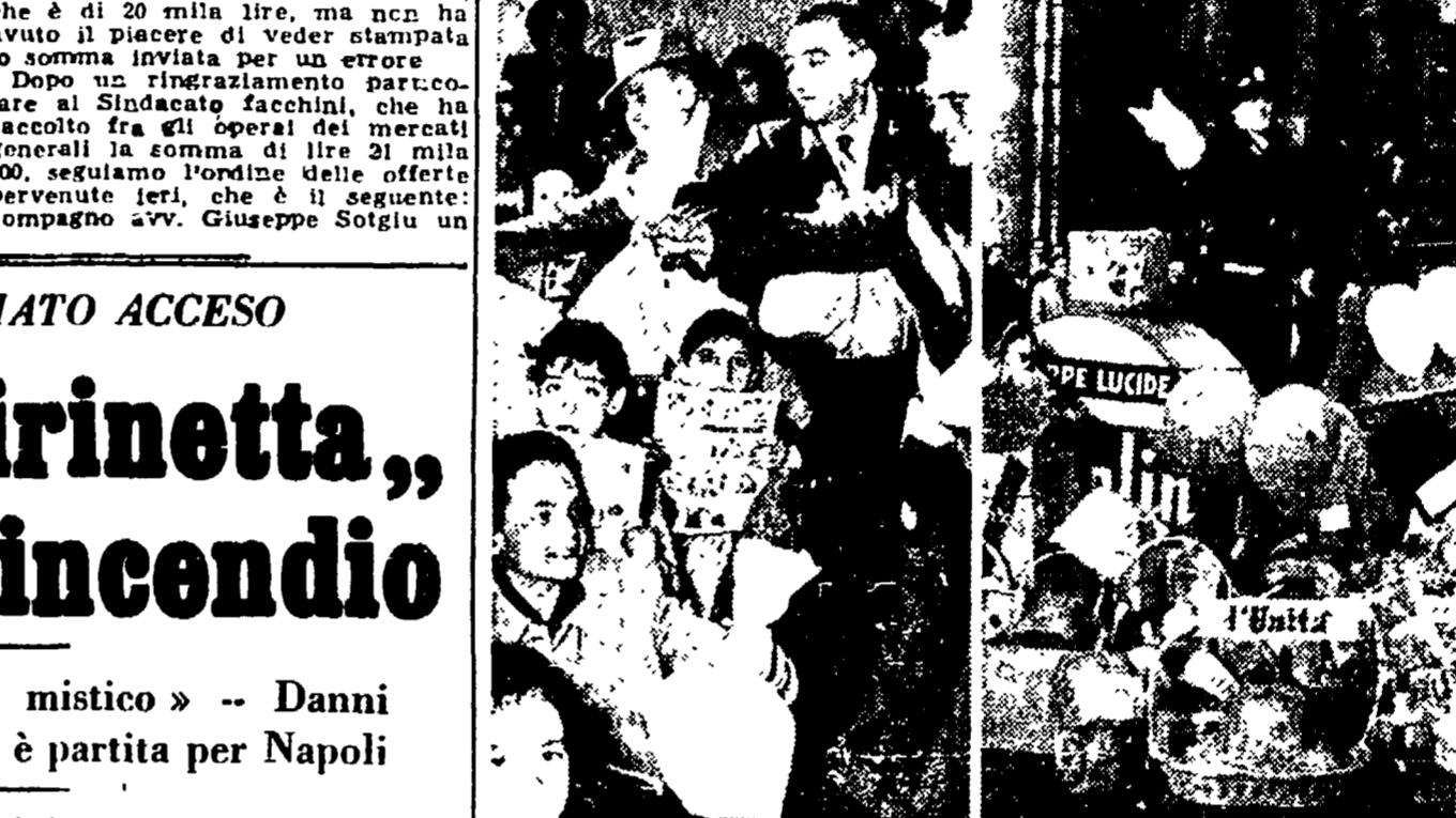
La Befana è trascorsa, ma non per tutti. Quelle dell'Unità, per esempio, arriverà con qualche giorno di ritardo.

La Befana è trascorsa, ma non per tutti. Quelle dell'Unità, per esempio, arriverà con qualche giorno di ritardo, una settimana per essere precisi. E si prepara a varare il suo sacco nelle tasche dei bambini più poveri, di quelli che ogni anno troverò i doni dal nostro giornale. Pochi giorni dunque: domenica prossima, la Befana non aspetterà più un seguito e si ripartirà il prossimo anno. I nostri lettori hanno capito che la Befana dell'Unità arriverà con una settimana di ritardo, e, generosi come al solito, continuano ad inviargli il loro contributo.