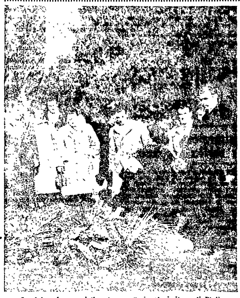
La delegazione sovietica depone fiori nel cimitero di Piacenza