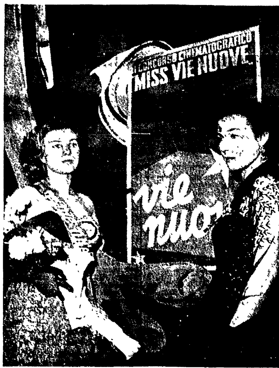
Nel corso di un'annunziata festa svoltasi domenica sera nei locali del Circolo artistico a Roma, ha avuto luogo la premiazione del concorso di bellezza...