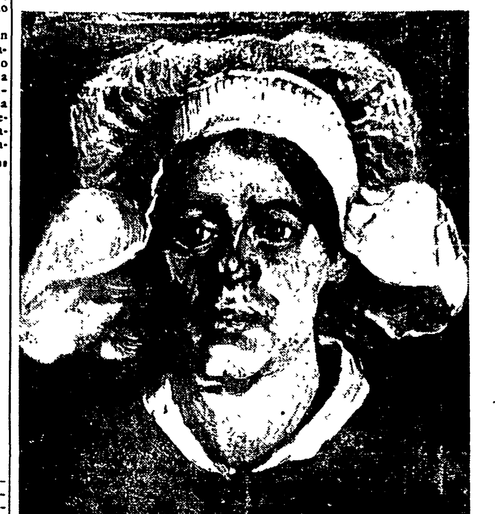
VINCENT VAN GOGH: «Testa di contadina»