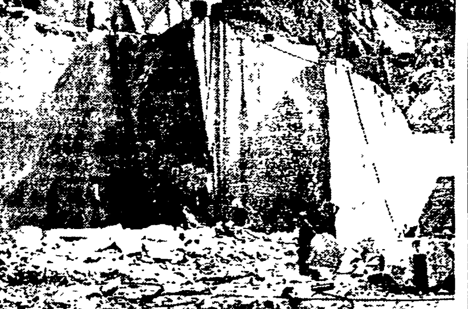
CARRARA - L'aspetto di una delle famose cave di marmo