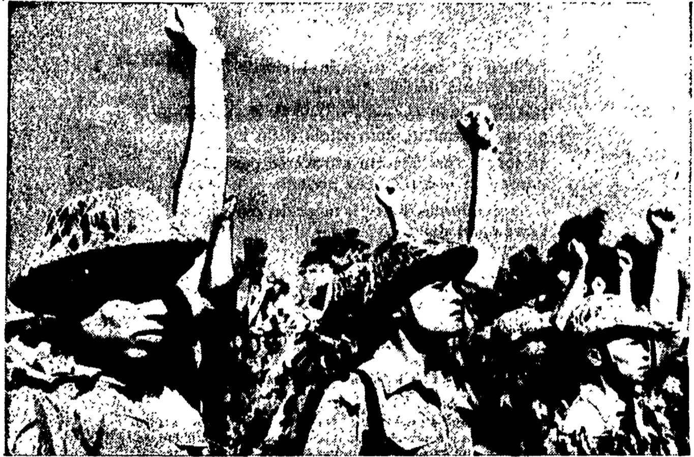
VIET NAM — Soldati dell'Esercito popolare del Viet Nam festeggiano la grande vittoria di Hoa Bin in occasione della vittoria. Il Presidente della Repubblica democratica del Viet Nam, Ho Chi Min, ha inviato ai comandanti ed alle truppe dell'Esercito un messaggio di congratulazioni. Durante la battaglia di Hoa Bin i colonialisti francesi hanno perso, secondo le cifre finora accertate, almeno 22 mila uomini