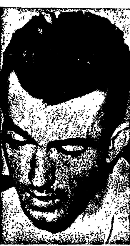
Bobet ha una segreta speranza: ripetere il colpo dello scorso anno