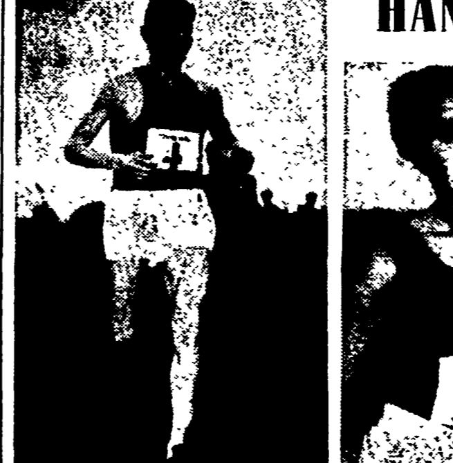
Era previsto un successo - dicono i giornali francesi - ma i sovietici hanno stravinto, dominato, trionfato e sfata una gara, una competizione. E' stato un monologo degli alleati...

«Sarà un traditore questo giovane?», pensava Peretti. «Sarà un uomo di Guisa?». E pensava al suo destino, e a quello del regno di Francia che erano, ora, nelle mani di quello sconosciuto.